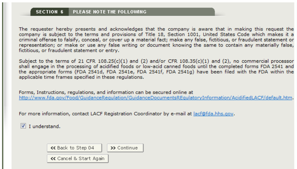
図 18 : ステップ 6 - セクション 6 次の点に注意

ユーザーが登録した情報を見直し間違いがあればそのことを認識できるように、フォームの各セクションに登録が完了した情報を表示する（図19にAF/LACF電子登録情報の完全な要約を表示する画面の例を示す）。