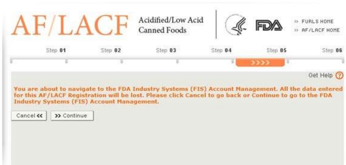
図 16 : FIS アカウント管理に進むときの警告メッセージ

もしユーザーが「Cancel」（取消）を選択すれば、すでに入力したデータは消失することはない。しかし、もしECPの連絡先情報に誤りがある場合は、誤りを修正する唯一の方法はFIS電子ポータルアカウント管理に進みそこで情報を修正すること（図17にFISアカウント管理の画面を示す）。