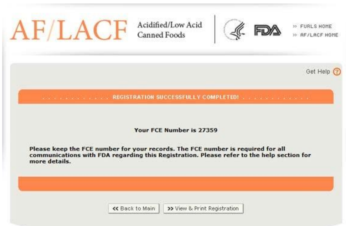
図 20 : FCE 番号が割り当てられ登録は完了