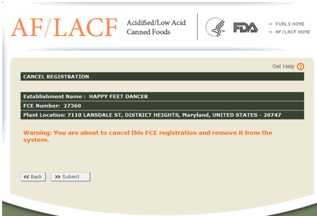
図 25：登録抹消警告メッセージ

登録を抹消するために、登録変更画面から「Cancel Registration」（登録抹消）、次に「Continue」（続行）を選択する。該当する施設のFCE情報は抹消されシステムから削除されるとの警告メッセージが表示される（図25にFCE情報がシステムから削除されるとの警告メッセージを表示した登録抹消画面の例を示す）。