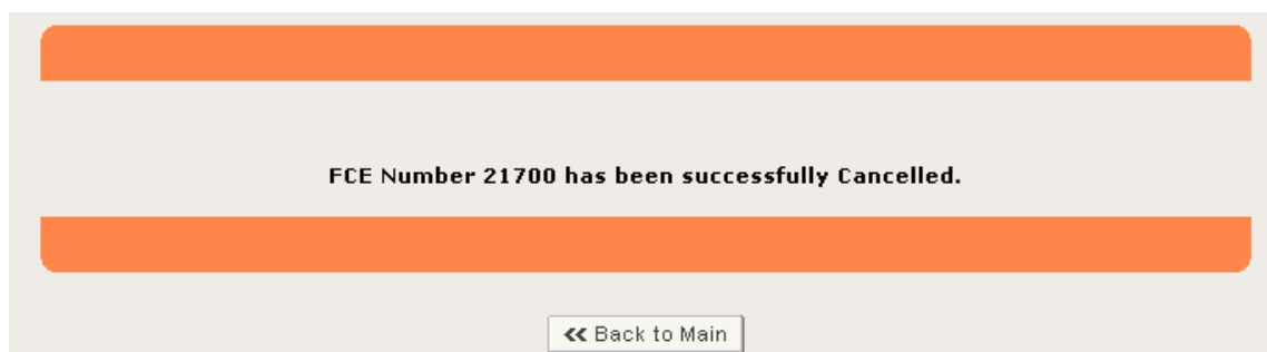
図 26：登録抹消メッセージ