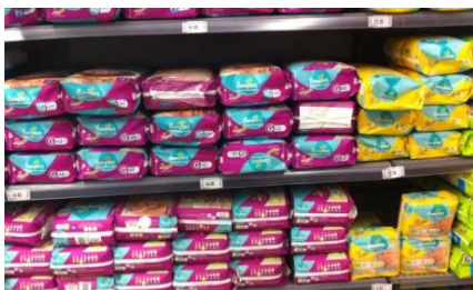
Pampersの上級品と新生児用。(下位中所得層居住域の量販店にて)

ここ10年来でリマ首都圏では個人商店の仕入れを念頭を置いた大型量販店が相次ぎ出店し、需要のある乳幼児用紙おむつは各社が特売戦略でしのぎを削っている。