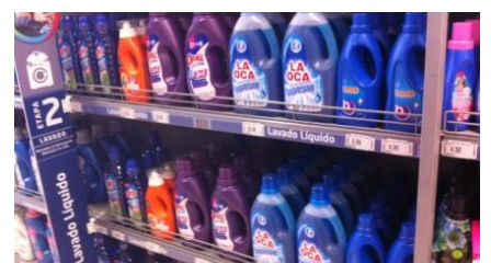
液体洗剤は経済効率が良いとの評判からシェア拡大の兆し