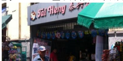
業界2位のTai Heng。チェーン店は多くなく、卸しを兼業