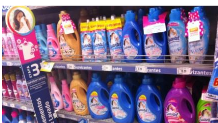
洗濯機の普及とともに売り上げを伸ばす柔軟剤

洗濯機が普及していない低所得者層や地方では固形洗剤は根強い人気を誇る。一方、近年、中間所得層にも洗濯機が急速に普及しており、各社が液体洗剤を相次ぎ発売しているほか、柔軟剤の市場も拡大しつつあるようだ。