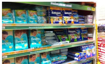
下位中所得層居住域の量販店で売られるPampersとBabysecの製品