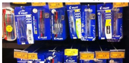
大型量販店にずらりと並んだ日本ブランドの製品

筆記具では国内メーカーのArtesco、Layconsa、Vinifan、Arti、Ove、外資系老舗のFaber CastellやStabiloなどのドイツ勢に加え、仏Maped、米Sharpieのほか、日本ブランドも存在感を示している。Faber Castellはペルー国内に生産拠点を一つ持つ一方、Artescoを初め国内メーカーは一部商品を国外に製造委託している。