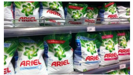
Arielはレギュラーに加え自社の柔軟剤配合と漂白剤配合の3種を揃える

洗濯機が普及していない低所得者層や地方では固形洗剤は根強い人気を誇る。一方、近年、中間所得層にも洗濯機が急速に普及しており、各社が液体洗剤を相次ぎ発売しているほか、柔軟剤の市場も拡大しつつあるようだ。