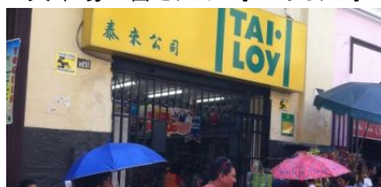
文房具小売りで業界トップを誇るTai Loy、チェーン店多数

ペルーの文房具小売業界は、中国華僑が経営するTai Loy、Tai Hengや自社工場も持つ民族資本のContinentalなどが上位を占め、華僑系の本店はごみごみとした旧市街の1地区に集中している。2月は文房具市場の書き入れ時である入学・進学シーズンに重なり、休日・平日問わず買い物客でごった返している。