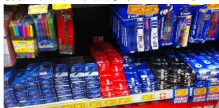
大型量販店で目を引くFaber CastellとArtescoの商品