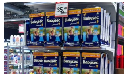
下位中所得層居住域の量販店のBabysec特売コーナー