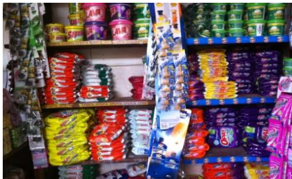
下位中所得層居住区の市場の売店。客の声に応え品揃えがよい

ペルーの粉末洗濯洗剤は、国内大手AlicorpがOpal、Bolivar、Marsellaの3ブランド、外資大手P&GがAriel、Ace、Magia Blancaの3ブランドを展開。これに食器洗剤で知られる国内メーカーIntravecoのSapolioが加わる