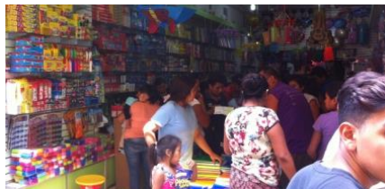
こうした店舗は個人商店の卸しと一般客向けの小売りを兼ねる