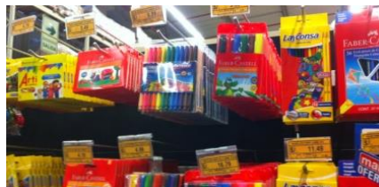
大型量販店で売られる水性サインペン。個人商店の卸しを兼ねる

筆記具では国内メーカーのArtesco、Layconsa、Vinifan、Arti、Ove、外資系老舗のFaber CastellやStabiloなどのドイツ勢に加え、仏Maped、米Sharpieのほか、日本ブランドも存在感を示している。Faber Castellはペルー国内に生産拠点を一つ持つ一方、Artescoを初め国内メーカーは一部商品を国外に製造委託している。