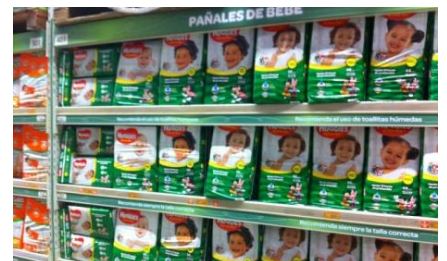
下位中所得層居住域のスーパーマーケットに並ぶHuggiesの製品

個人商店の仕入れではなく下位中所得層や貧困層の一般顧客はブランドよりも安さが購買動機の決め手となる。チリに本社のあるEmresas CMPCのBabysecの特売戦略はこうしたローカル市場を熟知した強さが覗える。