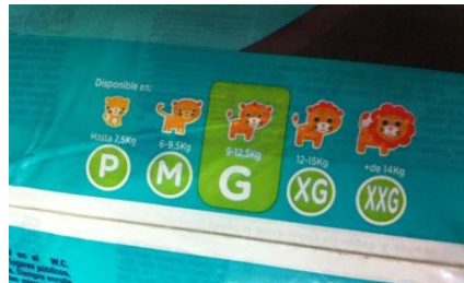
Pampersの5段階のサイズ表示