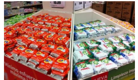
P&Gの洗剤3ブランドAce、Ariel、Magia Blancaの500g入り特売

Bolivarは色柄物用やしみ抜きなどの機能別製品を展開。Arielはレギュラーに加え柔軟剤配合と漂白剤配合の3種を揃える。また、低所得層をターゲットとしたMarsella、Magia Blanca、Sapolioなどの廉価品もある。