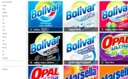
Alicorp社が売り出す洗濯洗剤のラインナップ