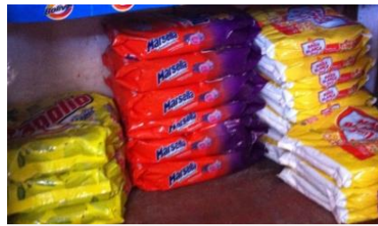
低所得者層に人気のMarsella、Magia Blanca、Sapolio