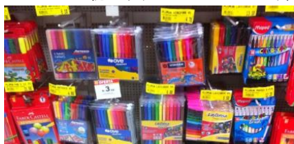
文房具チェーン店で並んだ各メーカーの水性サインペンセット