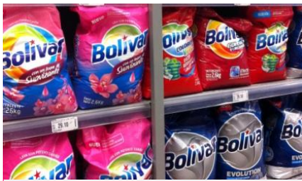
色柄物用、濃色用、シミ取りなど多種類を揃えるBolivarの粉末洗剤

Bolivarは色柄物用やしみ抜きなどの機能別製品を展開。Arielはレギュラーに加え柔軟剤配合と漂白剤配合の3種を揃える。また、低所得層をターゲットとしたMarsella、Magia Blanca、Sapolioなどの廉価品もある。