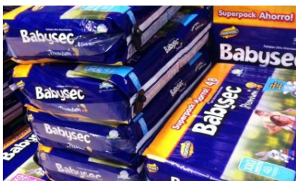
Babysec PremiumのXXG、増量48枚入り、特売品35.9ソル

個人商店の仕入れではなく下位中所得層や貧困層の一般顧客はブランドよりも安さが購買動機の決め手となる。チリに本社のあるEmresas CMPCのBabysecの特売戦略はこうしたローカル市場を熟知した強さが覗える。