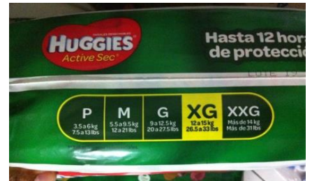
Huggiesの5段階のサイズ表示

ここ10年来でリマ首都圏では個人商店の仕入れを念頭を置いた大型量販店が相次ぎ出店し、需要のある乳幼児用紙おむつは各社が特売戦略でしのぎを削っている。