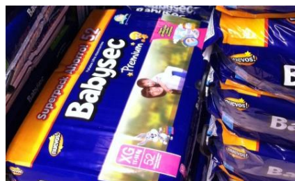
Babysec PremiumのXG、増量52枚入り、50.6ソル