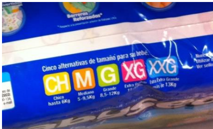
Babysecの5段階のサイズ表示

乳幼児用紙おむつ市場は、Babysec(Emresas CMPC)、Pampers(Procter & Gamble)、Huggie(Kimberly-Clark)の3社の寡占状態といってよい。個人商店ではHuggiesとPampersがばら売りされていることが多いがBabysecは40枚入り以上のパックで、スーパーマーケットや量販店でしか見かけない。