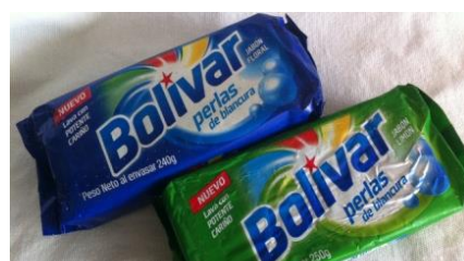
Bolivarは手洗い洗濯に欠かせない固形の洗濯洗剤の代名詞でもある