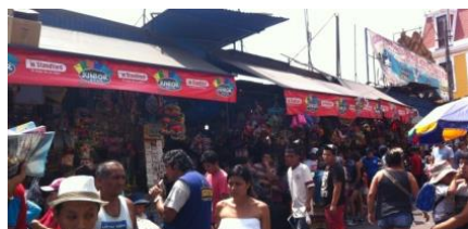
買い物客で賑わう週末の旧市街の文房具屋街

さて、ペルーの義務教育制度のうち6年制の小学校の筆記用具は鉛筆であるが、5年制の中学校からボールペンが指定される。試験でも数学などを除きボールペンを使用することから、滑らかな書きやすさ、インクの持ちはもちろん、液漏れやインク乾燥が起きにくいなどクオリティが重視される。