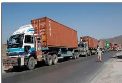
<コンテナ・トレーラー>