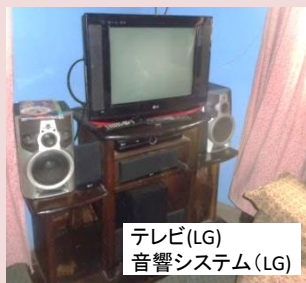
テレビ(LG) 音響システム(LG)