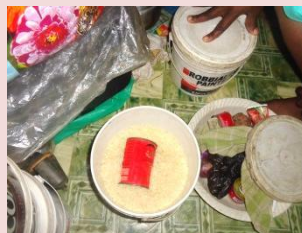
食品はプラスチック容器に入れて床に置いている。