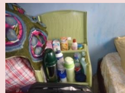
部屋は物で溢れている