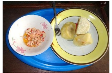
昼食に茹でたヤマ芋とエッグ ソース