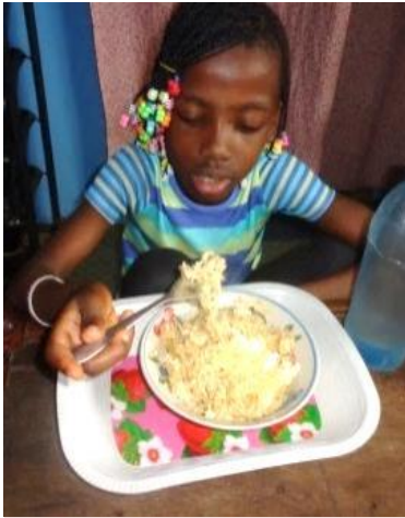
麺は主に子供のため