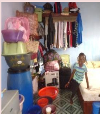
寝室が一つだけのアパート