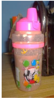
末っ子は母乳と 粥を哺乳瓶で飲 んでいる。