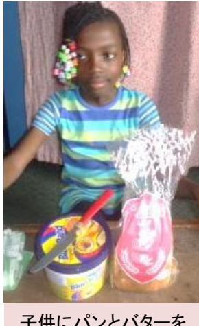
子供にパンとバターを ココアと一緒に