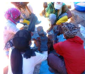
ハンマーを使ってさらによく練る

②練り上げた粘土を型に埋め込むようにして力強くつめて、上の型と型をぴったりと密着させてプレスし、ポットの型を取る。その際、型の内側にビニールを敷くことで粘土と型が付くのを防止している。現在、工場は電化されていないため、電力に頼らなくても製造が可能な手動式のプレス機を使っている。このプレス作業には成人男性2人が必要である。