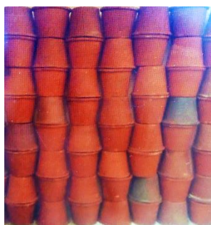
焼きあがった素焼きのポット

現在は細々としか製造を再開できていないため、生産個数は1日に30～40個となっている。