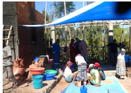
焼き窯(左)と作業場