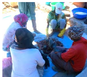
粘土と材料を練り合わせる