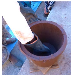
角をきれいにする