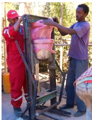
粘土をつめた型に上の型を合わせる