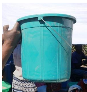
製品の外側となるプラスチック製のバケツ