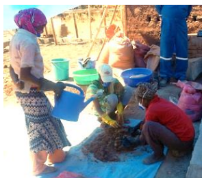
粘土とおが屑を混ぜ合わせる