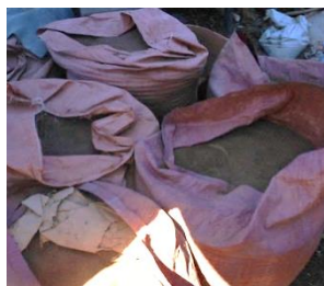
素焼きポットの材料の粘土