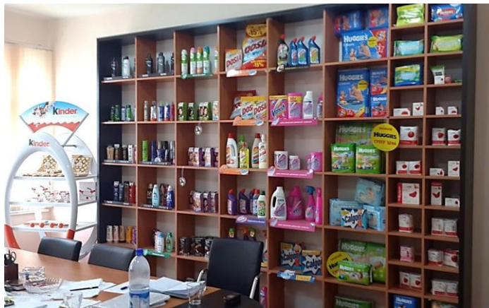
販売管理センター内の小物商品陳列棚

GRANplusは市場やマーケティングのノウハウに関して深い知識と経験を有すると共に、企業運営の透明性にも優れている。同国市場では、高級品に対する需要が拡大しつつあり、それら製品を含め同国進出にあたっては、GRANplusやその関連企業と提携することが有効と思われる。