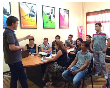
研修・ヒアリングの様子

高い品質とユニークな製品の多い日本企業には強い関心を持っており、洗剤や消毒剤、使い捨てオムツ、女性用衛生用品などを扱う企業があれば、是非商談したいとしている。特に日本製の使い捨てオムツに関心がある。