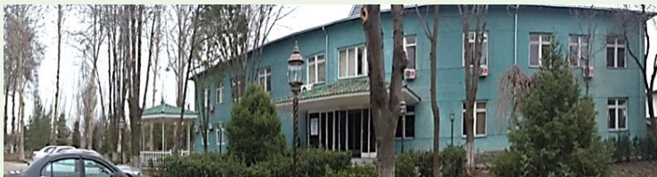
販売管理センター