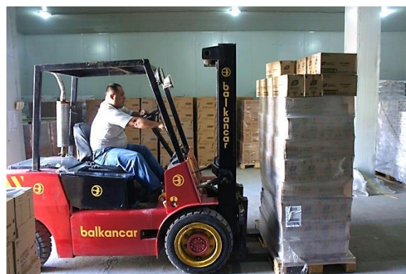
倉庫での荷役作業