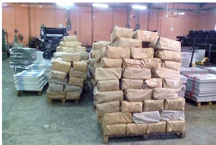
出荷を待つ梱包された製品