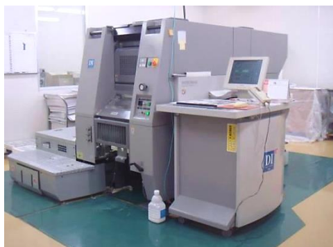
デジタルオフセット4色印刷機(RYOBI製)