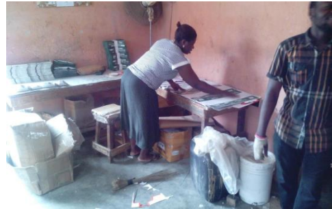
工場内での作業の様子