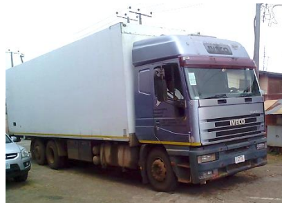
自社の配送用大型トラック