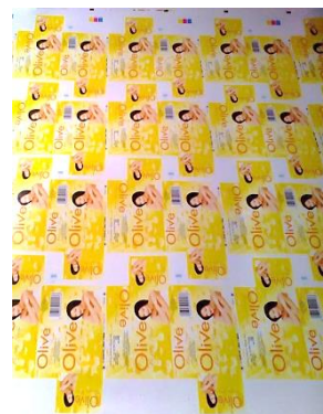
大衆向け石鹼メーカーの商品パッケージ(裁断前)