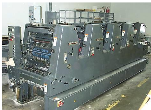
オフセット印刷機(HEIDELBERG製)

国内印刷企業は、顧客のニーズに合わせるため最新の原資材や機械の入手に努め、政府も政策的支援を行っていることから、それら企業の収益拡大も見込まれ、関連する業界全体の経済発展に貢献するものと思われる。