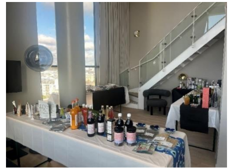
昨年度の開催風景（ヘルシンキ）