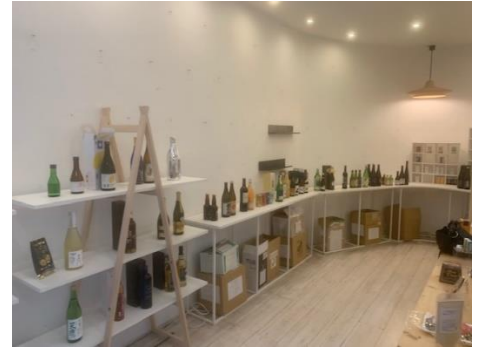
昨年度の開催風景（パリ）