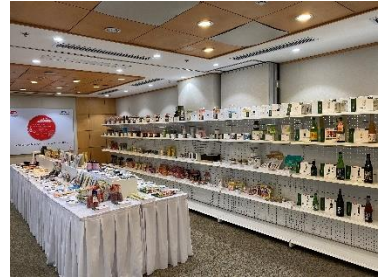
昨年度の開催風景