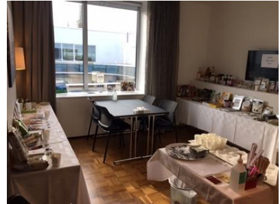
昨年度の開催風景（ストックホルム）

6月下旬 採択通知 6月下旬 事前マッチング（ストックホルム） 7月 国内倉庫への納品 8月下旬 事前マッチング（ヘルシンキ） 9月 ショールームオープン（ストックホルム） 1月 ショールームオープン（ヘルシンキ）