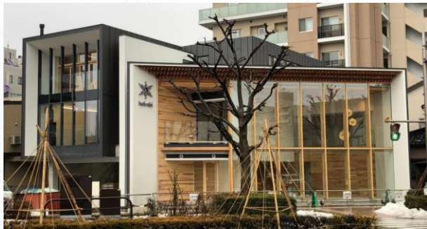
テスト販売施設 HOKUBI KANAZAWA