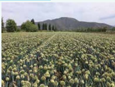
野菜種子の栽培（ネギ）