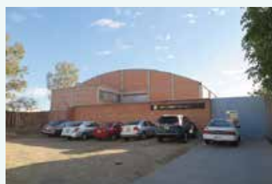
SHONAN MEXICO S.A. de C.V. (湘南メキシコ) の様子