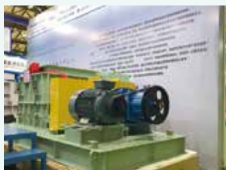
中国バイオガスプラントに納入した同型破砕機