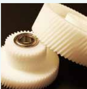
同社製品の高精度歯車製品