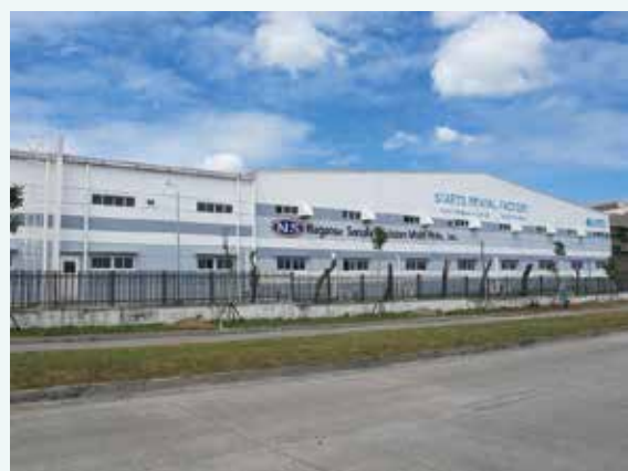
フィリピン工場外観