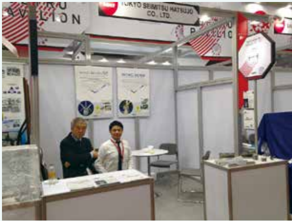
タイ METALEX2016 出展時の様子