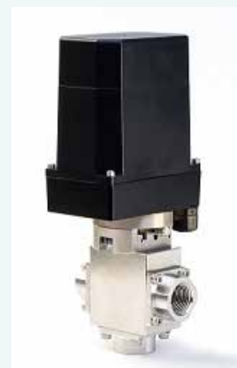
高精度 制御バルブ

更なるビジネス拡大に向け、新規顧客の開拓や現地での新たな業務委託業者の開拓に取り組んでいく。