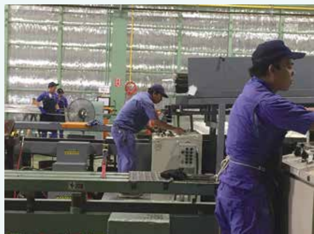
フィリピン工場作業風景

現在は試作生産を終え、本格的な量産体制に入りつつある段階。今後は「100年企業」を目指し、フィリピン工場を拠点としたアジア圏での販路拡大とさらなる事業基盤強化を推し進める。