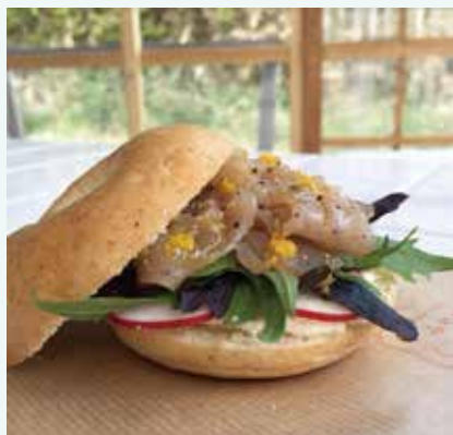
「マグロフレッシュハム」をサンドしたペーブル