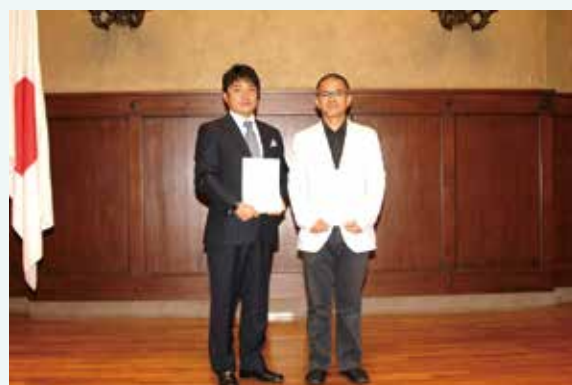
地域産業資源活用事業の認定証交付式