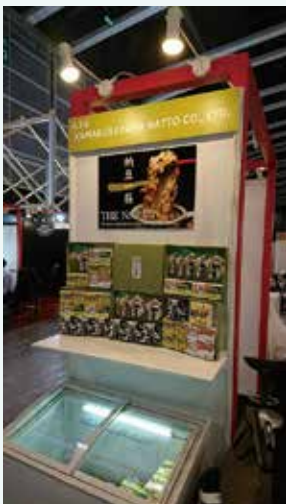
海外展示会 FoodExpo 香港でのブース