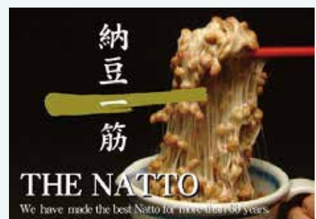
鎌倉山納豆の海外PR資料

今後は香港からの具体的な成約を目指すとともに、東南アジアや中国、世界への販路開拓を狙っていく。