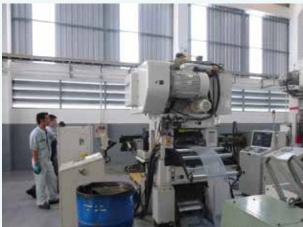
現地タイ工場の様子