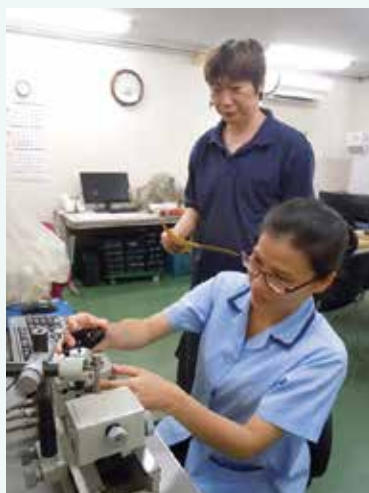
ベトナム出身のウエンさん