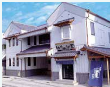
野呂食品本店（鎌倉市）