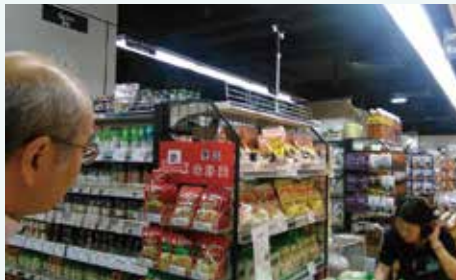
香港スーパー試食会に同行支援した専門家（左）