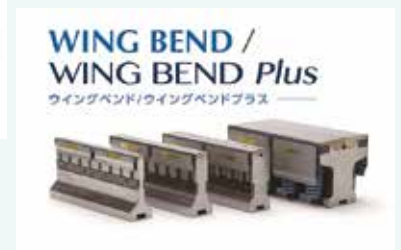
金属板曲げ加工用金型