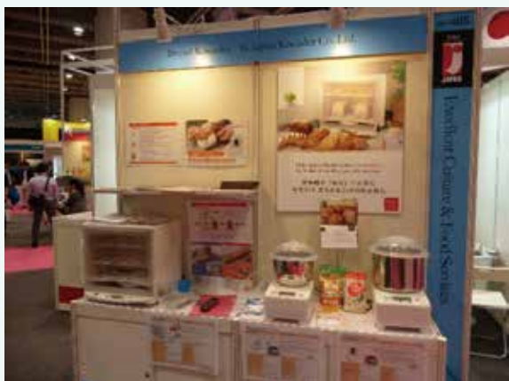
海外展示会 Hofex 香港へ出展