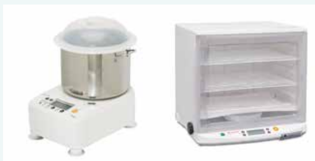
同社のパンこね機（ニーダー）と発酵器

有名料理家による利用や SNS での評判が販売数に大きく影響することも踏まえ、現地代理店と協力しながら販路拡大を目指す。既に取引のある台湾、タイに加え、「パンの本場」米国においても販路開拓を目指す。同時に、個人事業主がベーカリー、カフェ、レストランなどを開業する際に、同社製品を活用したメニューや最小限の設備投資を提案するサービス「Compact & Smart Bakery」を世界に拡げていきたい。