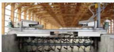
F1 (Phase-1 system), stirrer twin rotor rotary blade