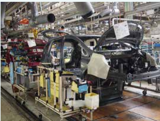
自動車生産設備のメンテナンス

法人設立後も本格稼働に向けて、現地での販路拡大や社内体制の整備をメキシコに精通するJETRO 専門家から助言を受けつつ進めている。日本語・スペイン語が使える日系人（中南米出身、社内人材）がメキシコに駐在し、現地でのビジネスを後押しした。工場内の現地責任者やローカルスタッフとスペイン語で意思疎通しながら、日系企業及び日本人が求めるきめ細やかで質の高いサービスを日本語・スペイン語で提供できるという自社の特長・強みを生かしている。同州のみならず周辺州の自動車関連企業へ販路を広げて、新たな拠点設立を予定している。