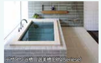
デザイン浴槽（選美槽 ERN Seriese）