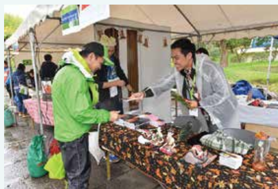
積極的にサポーターと交流を図る研修生

まだ構想の段階だが、インドネシアでのスポンサー開拓、営業拠点設置等の展開を検討していきたい。