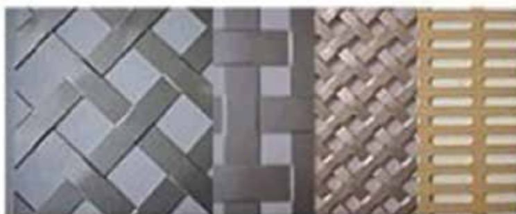
同社製品のパンチングメタル