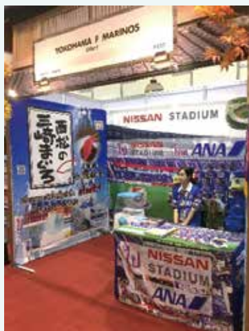
「タイ国・旅行博」の出展ブース

2018年10月、収集した海外ニーズを基に「まぐろフレッシュハム」を開発、経済産業省地域産業資源活用事業にも採択された。今日までの活動で培ったネットワークと、真のニーズにマッチした新商品を武器に、一層の海外販路開拓が始まる。