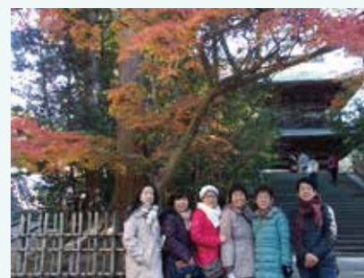
社員の方との旅行の様子