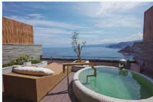
ホテル・旅館 施工例 1