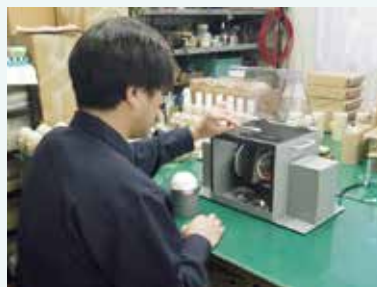
ナガオシステム作業図