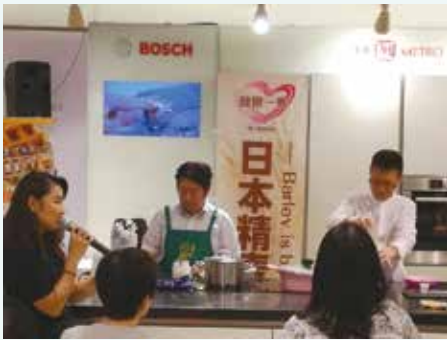
シンガポール催事でのワークショップ