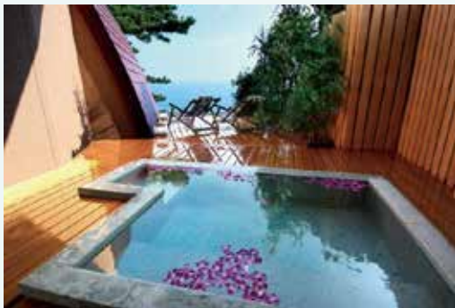
ホテル・旅館 施工例 2

また、国内では米国 CAMBRIA 社とクォーツストーン（高硬度高級人造石）の総代理店契約を締結し、キッチン台などにも取扱品目を広げ、よりデザイン性、耐久性に優れた製品を展開できるようになった。