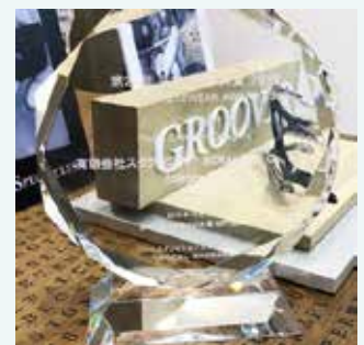
2018年「メガネ大賞メンズ部門」を受賞