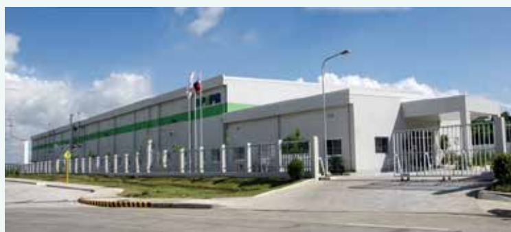
フィリピン工場全景