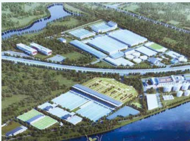
蘇州建設現場完成予想図

技術力を武器に自社の製品を世界に広げたいとの強い思いで、2015年度より JETRO 専門家による支援を活用。専門家のネットワークを活かし取引先候補の開拓を進めると共に、専門家同行による現地出張で、積極的に環境技術関連企業への訪問を行ったことが功を奏し、2017年度に中国での食品残渣バイオガスプラント大型案件の受注に成功。（発注元：蘇州市の工業団地上下水道運営会社、受注元：欧州の EPC 企業。ここが日系エンジニアリング企業を経由して破砕機をヘリオスに発注。）2019年の施設本格稼働に向け準備を進めている。この商談を契機に新たな現地法人設立の可能性も出てきており、今後、中国での更なる販路開拓、取引拡大に注力していく。中国以外においても、専門家の助言を受けつつドイツの水処理／廃棄物処理／リサイクル技術見本市へ出展するなど、積極的に海外販路開拓を行っている。又、国内人材の採用難を鑑み、技術継承・維持・強化のため、今後、インターンシップも含めた外国人材の採用・活用にも力をいれていく。