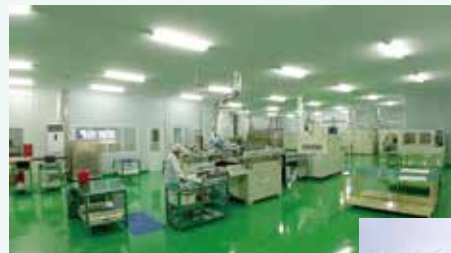
ベトナム工場内印刷室

また 2018年7月の神奈川県主催ジョブフェアでは、ベトナム高度人材の採用を決定した。今後は外国人材と共に、安定的生産体制の構築と海外販路開拓に注力していく。