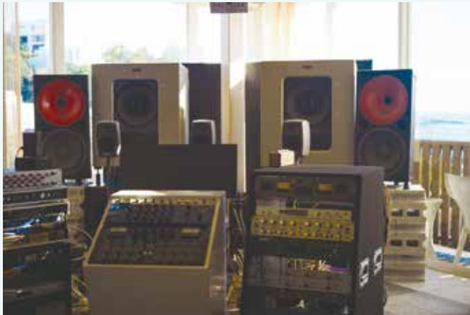
プレミア・マスタリングスタジオ