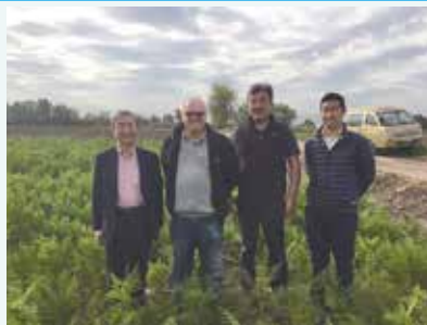
野菜種子の栽培（人参）