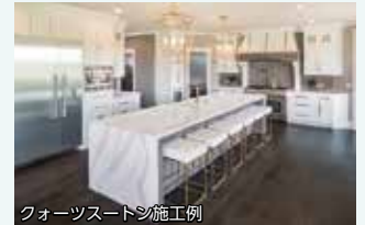
クォーツストーン施工例