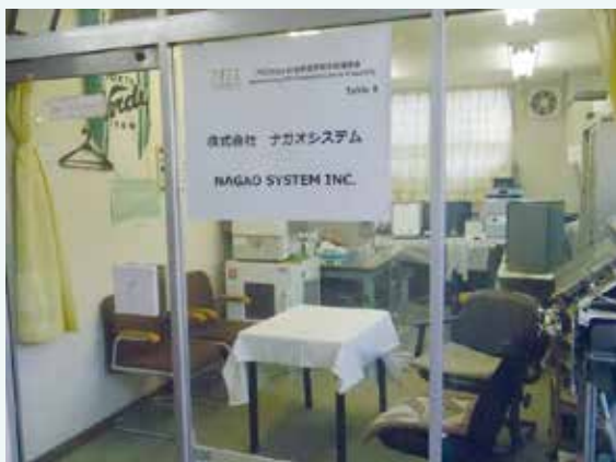
ナガオシステム会社

JETROの海外展示会出展支援を利用し、タイ・ベトナム等で現地企業と商談を行ったが、活用範囲の広い製品であることから、販路開拓先として注力すべき業種・業界の選定が課題となった。2017年よりJETRO 専門家と共に各種調査・情報収集を行うことで取り可能性の高い国・業種を絞り込み、2018年2月にタイ理化学機器商社との販売店契約を締結。さらに同国大学・石油公社へ3次元ボールミルの販売に成功した。今後は米国・欧州への展開にも積極的に挑戦していく。