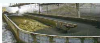
F1 (Phase-1 system), total length 25 to 70 m, depth 1.3 to 1.5 m, width 8.3 m