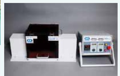
小型3次元ボールミルマニュアル