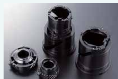
光学機器向け精密成型部品

今後はフィリピン、及び周辺国の新規取引先開拓、医療機器等新分野への部品供給にも積極的に取り組んでいく。