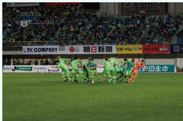
湘南ベルマーレ試合風景