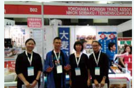
シンガポール展示会の県内ブースに出展