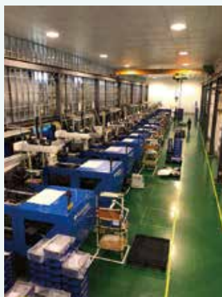
フィリピン工場内部