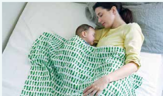
商品使用イメージ