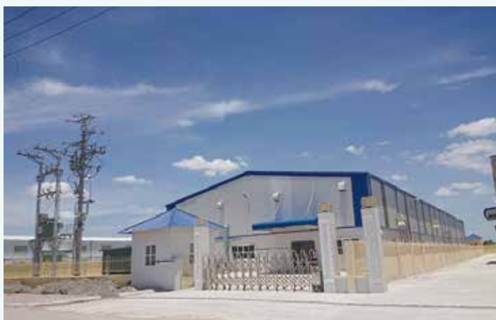
ベトナム工場外観