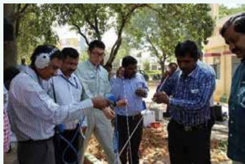
漏水トレーニングの様子

今後は、契約済の漏水調査トレーニング、並びに将来的な漏水調査事業がスムーズに行えるよう、随時 JETRO 支援事業を活用していく。