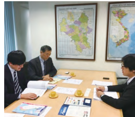
ジェトロ・ハノイ事務所での情報提供