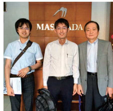
インドネシアでの商談サポート