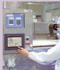
用最新的设备做出安全的商品

把蛋黄和蛋白搅拌后加入清汤，用砂糖调出甜味，然后用平底锅煎烤成形的食品。也被用作攥寿司的材料。寿司通往往一开始就点“煎蛋卷”，以确认该店的味道和厨师的手艺，由此可见煎蛋卷是一种既费工夫又费时间、门道非浅的寿司材料之一。煎蛋卷是一种男女老少皆宜的美食。