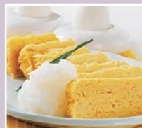
● 日式和中式的鸡蛋