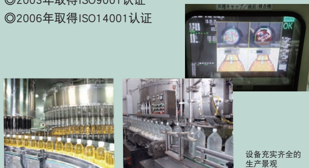
设备充实齐全的生产景观