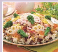
● 散寿司、模压寿司、油炸豆腐寿司