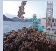
牡蠣の収穫はクレーンを使っての大きかりなもの