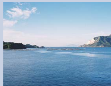
広島湾には牡蠣を養殖する牡蠣筏が浮かぶ