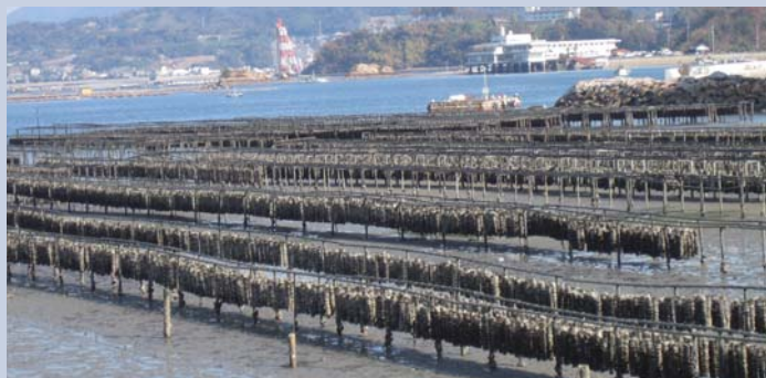
簡易垂下養殖法では干潟に杭を打って棚をつくる