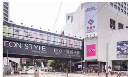
コーンヒル店（香港1号店） イオンでは世界一の売上を誇る