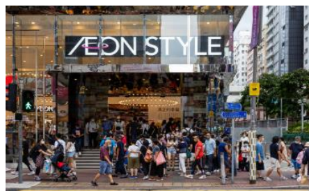
イオンスタイル旺角店 2022年オープン