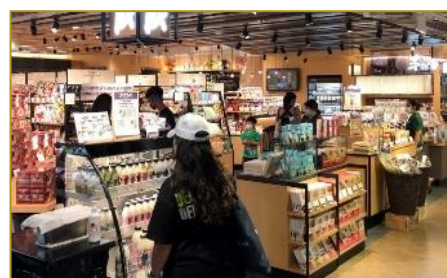
香港タイムズスクエア店内 日本食専門販売店「蔵」