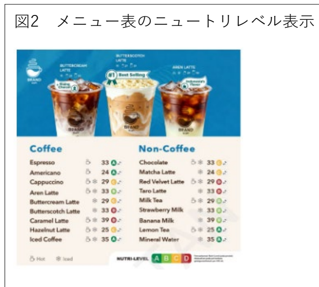
図2 メニュー表のニュートリレベル表示