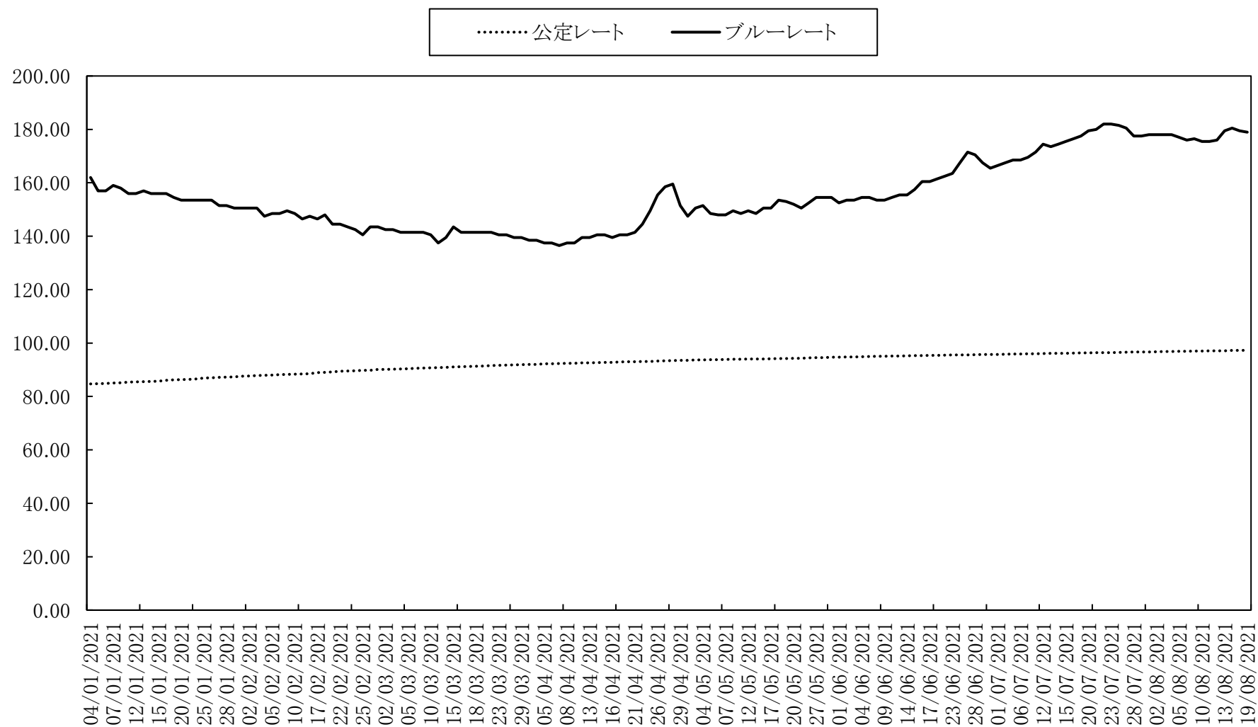
図3 為替レートの推移