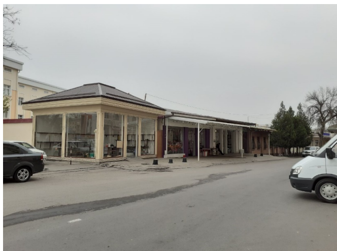
非食品の多くの店舗も閉鎖(通常は花屋)