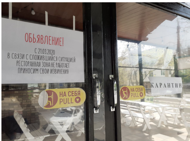
タシケント市内飲食店は検疫措置のため休業(宅配のみ)