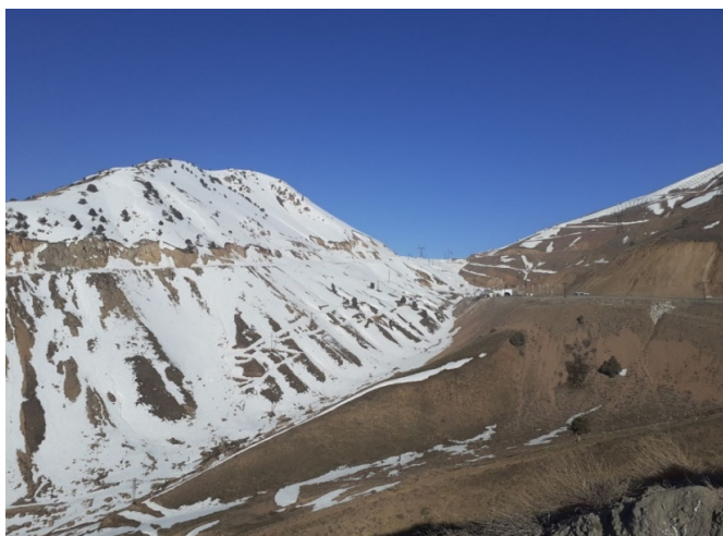
通行を制限されているカムチク峠