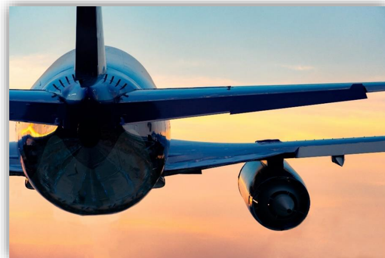
現地派遣プログラム※ 2024年1月9日～13日

目的： CESやシリコンバレーの最新動向やCES視察の活用法などを渡航前に学び、渡航のイメージを高める。