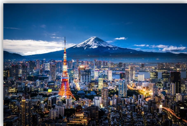
国内事前プログラム 2023年11月中旬

国内でのプログラムを経て、CESやシリコンバレーへ渡航。 現地で様々な人材と交流することで自身の起業等のマインドを醸成！