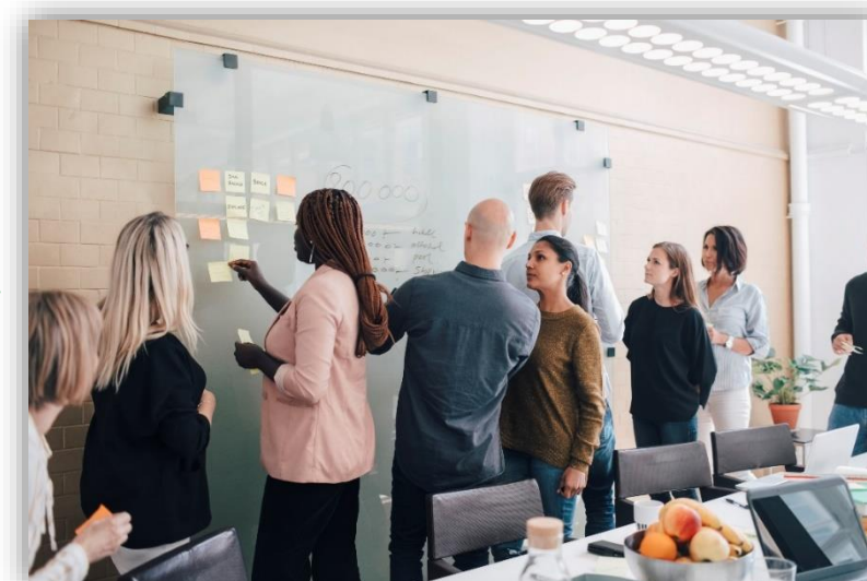
国内事後プログラム 2024年1月下旬～2月中旬

目的： 現地への派遣での学びを生かし、個別にメンタリングを実施し、自身の事業アイデアをブラッシュアップする。