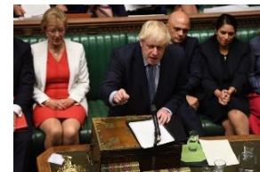
総選挙実施を野党に強く迫る ジョンソン首相