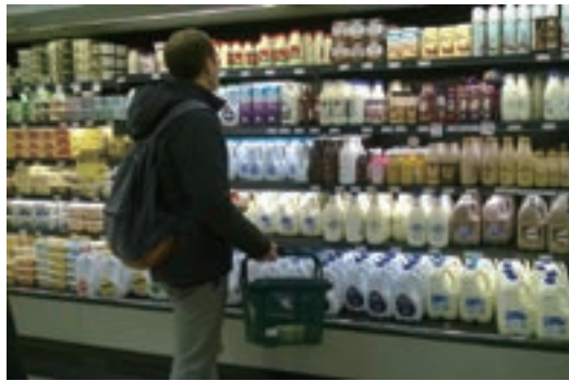
スーパーマーケットの牛乳売り場

街中の大手スーパーマーケットの牛乳売り場をのぞいてみた。1リットル 2.5~4.5 ニュージーランド・ドル（以下、NZドル）の商品が多い。そこで、3.5NZドル/ℓとして、現在の為替レート（1NZドル = 74.9円）で換算すると260円/ℓになる。円安時の2015年4月の為替レート（1NZドル = 91円）では320円/ℓだ。