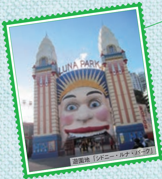
遊園地「シドニー・ルナ・パーク」