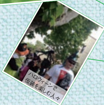
ハロウィンで 仮装を楽しむ人々