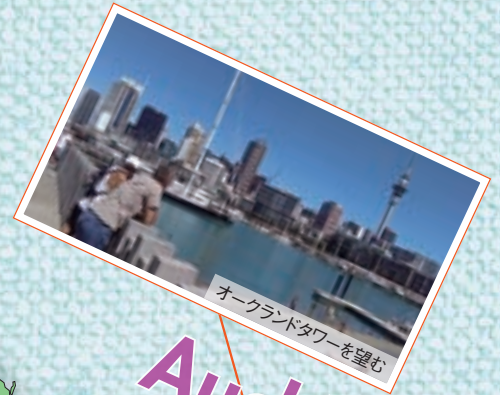
オークランドタワーを望む