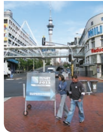
既に公式グッズ販売店も開店