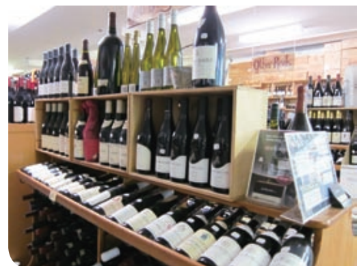
品ぞろえ豊富なワインショップ

当地で売られる豪州ワインは、1本数豪ドルから数百豪ドルのビンテージものまで、価格帯は幅広い。しかし高いものおいしいとは限らない。ワインの面白さであり奥深さでもある。(稲澤 定/シドニー・センター)