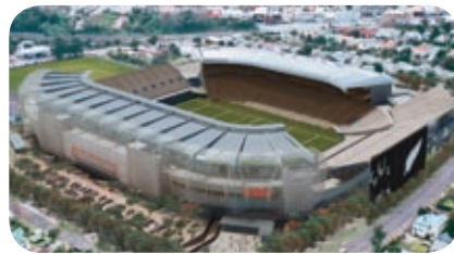
改装中のスタジアム

キウイ (ニュージーランド人) は本当にラグビー好き。有料テレビの中には六つのスポーツチャンネルがあるが、どのチャンネルを回してもほとんどがラグビー中継だ。この上さらにラグビー専用チャンネルがある。多くの子どもたちが将来オールブラックスの選手になる