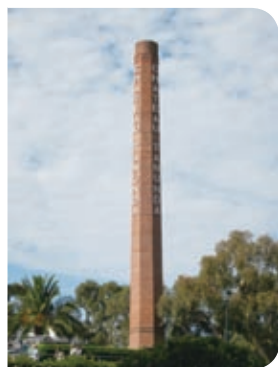
豪州最大のシャトーを有するワイナリー「シャトー・タヌンダ」(パロッサ・バレー)

シドニー郊外のハンター・バレーや、西オーストラリア州のマーガレット・リバーといった著名なワイン産地では、地元のワイナリーを訪問するツアーが催行され、国内外の観光客から好評を博す。参加者が宿泊するホテルへの送迎や昼食を付けた日帰りツアーであれば、100豪ドル（約7,500円）前後が相場だ。