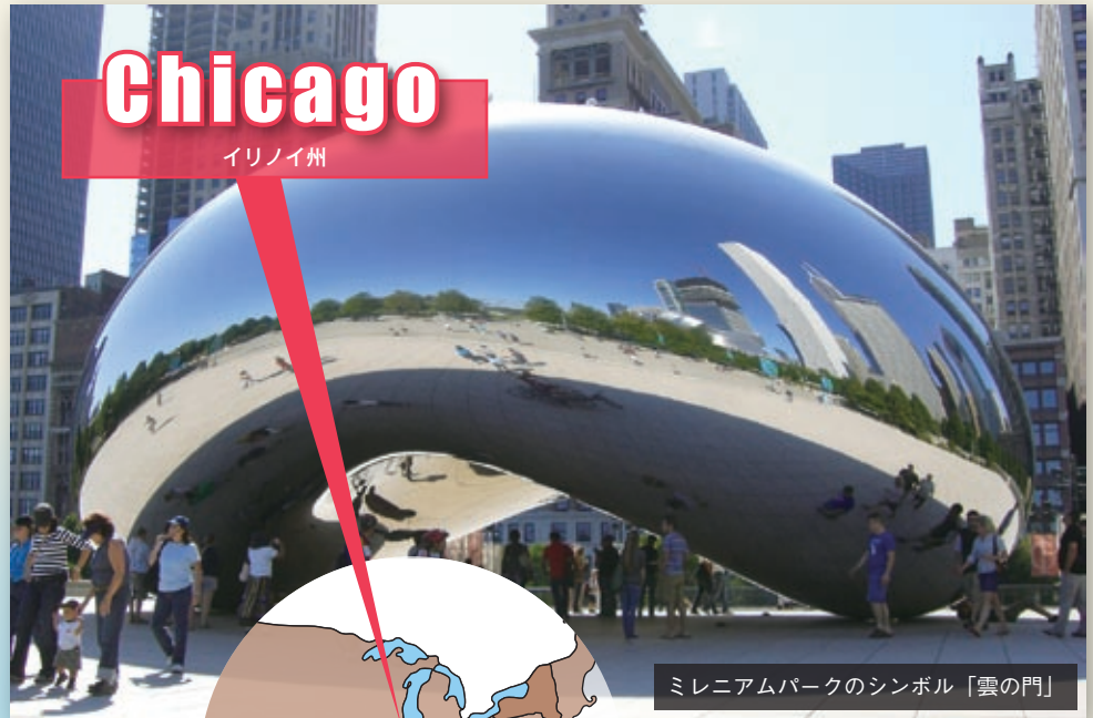
ミレニアムパークのシンボル「雲の門」

ニューヨークでは、通りに並び各国料理の屋台で路上シェフが腕をふるう。 シカゴの博物館では、夜間開館など斬新な企画で来場者の盛り起こしを図る。 アトランタのスポーツ競技場では、セレブセミナーが開催され、キャリアアップを目指す聴衆が全米から集まる。 北米3都市の話題の断面。