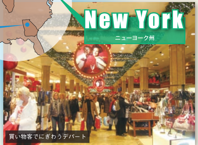
買い物客でにぎわうデパート