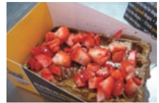
ワッフルにイチゴをトッピング

——ニューヨークのフードシーンに新たな魅力が一つ加わった。 （松本 貴子／ニューヨーク・センター）