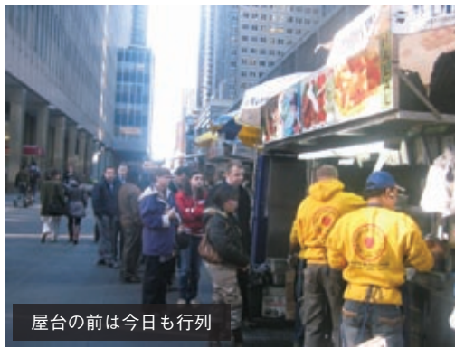
屋台の前は今日も行列

サルタントとして第一線で活躍してきたオーナーが、米国のワッフルを改革すべく、本場ベルギーの職人のもとで修業を積んだという。近づくと甘い香りが漂う。楕円（だえん）形・格子柄の通常のワッフルのほかに、長方形のものもあった。