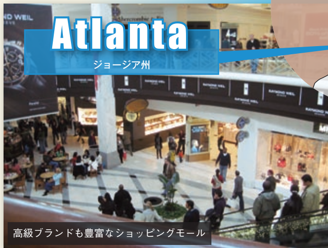
高級ブランドも豊富なショッピングモール