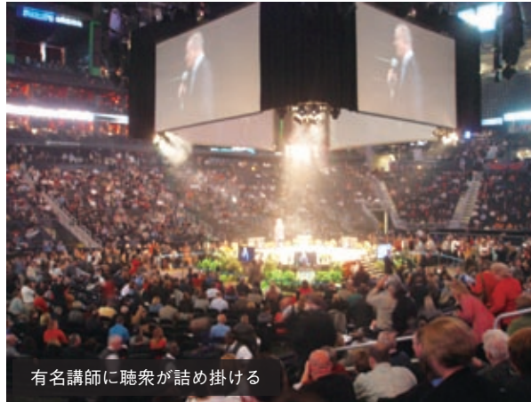
有名講師に聴衆が詰め掛ける

平日の朝8時から夕刻まで、政治、ビジネス、スポーツ、芸能界などで活躍のこれら有名人が多数登場し、自らの成功経験を引き合いに、キャリア形成、リーダーシップ、チームワーク、競争力などについて、直接、聴衆に語り掛ける。音響や照明の演出もあり、会場は、さながら人