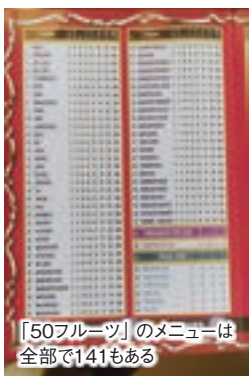
「50フルーツ」のメニューは全部で141もある

1日5回の礼拝が終わる夜8時ごろ、リヤド市内の飲食店は、食事や甘いデザートを楽しむ人々であふれる。聖地メッカを擁するサウジアラビアの社会生活はイスラム教を基本としており、アルコールはご法度だ。国内に酒類を提供する飲食店はない。酒を飲まないからか、サウジアラビア人は老若男女を問わず甘いものが大好きだ。ナッツやココナツミルクをふんだんに使った伝統的なアラブ・スイーツをはじめ、チョコレート、ドーナツ、アイスクリームなど、甘いものを売る店は多い。