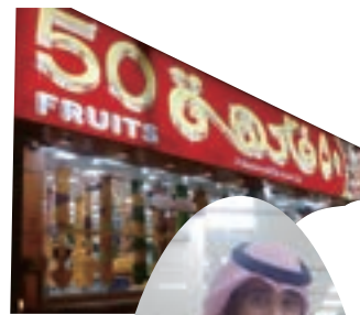
入り口は一つで外から店内が見える（写真上）家族の分までまとめて購入する男性（同下）