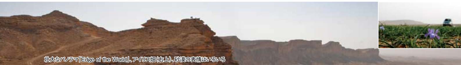
壮大なパノラマ「Edge of the World」、アイリス畑(右上)、砂漠の表情はいろいろ