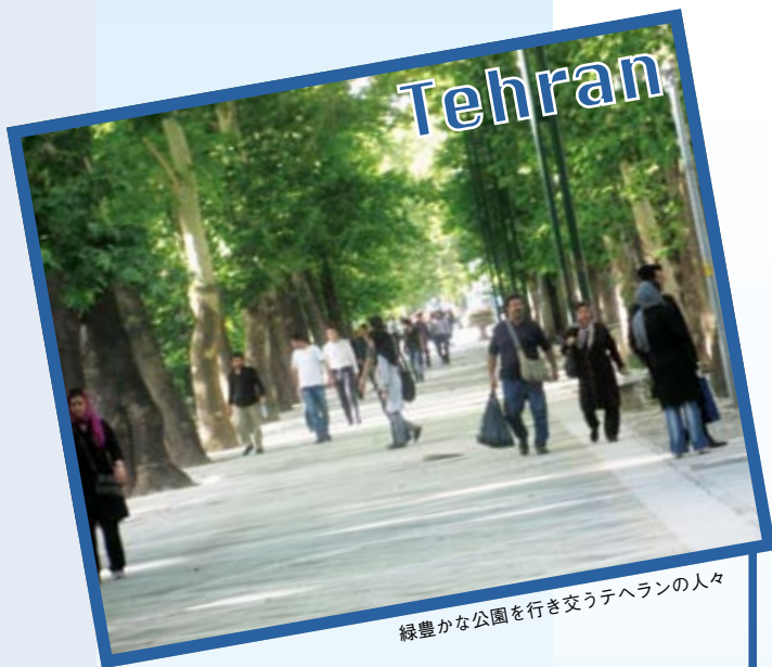
緑豊かな公園を歩き交うテヘランの人々

世界中からカフェやレストランが出店するドバイ。スカーフの色や柄でおしゃれを楽しむテヘランの女性。週末には砂漠でのんびり過ごすリヤドの人々。中東の暮らしの一端を紹介。