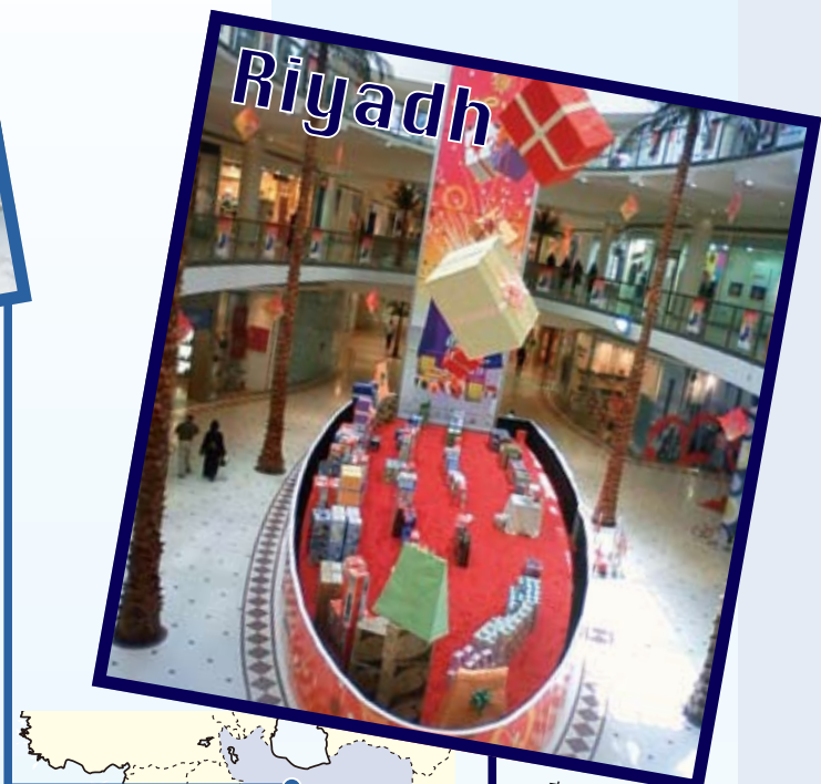
市内中心部にあるファイサリア・モール

世界中からカフェやレストランが出店するドバイ。スカーフの色や柄でおしゃれを楽しむテヘランの女性。週末には砂漠でのんびり過ごすリヤドの人々。中東の暮らしの一端を紹介。