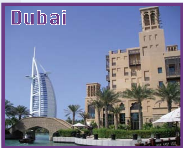
高級ホテルが立ち並ぶドバイ