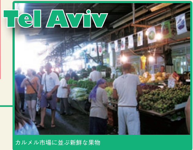
カルメル市場に並ぶ新鮮な果物