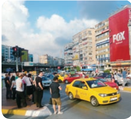
交差点には人とクルマがあふれる

37%、1,600cc以上60%、2,000cc以上84%）、高いガソリン代（物価データ参照）だ。数人のトルコ人に車選びのポイントを聞いてみると、「品質も気になるが、やっぱり価格が決め手」というのが本音のようだ。乗用車保有台数は680万台（08年）と、人口（7,256万人）の割に低水準にとどまっている。政府が昨年実施した自動車の特別消費