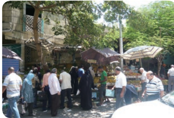
スークには新鮮な野菜や果物が並ぶ

だが大多数のカイロ庶民の日常の買い物は、近所のスーパーマーケット、個人経営の商店、スークと呼ばれる