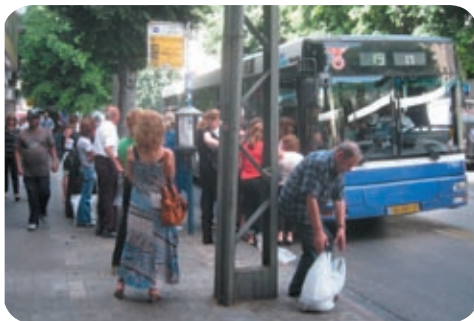
急停車・急発進するバス。乗り遅れないように…

だが、クルマは高い。トヨタ・カローラ（1,600cc）の新車は12万シケル（約275万円）。国内に自動車製造工場はないので、すべて輸入品だ。関税や購入税などは非常に高く設定されている。そのため中古車の価格も高い。走行距離10万キロ以上、外観がぼろぼろのクルマの相場が1,500ccクラスで1万5,000～2万ドル（約130万～175万円）で、筆者も購入を断念したことがある。大企業などでは福利厚生の一環で従業員にレンタカーを与え、昇進に従いそのグレードも上がる。ただ「自分のクルマ」との意識が薄いためか、多少ぶつけても気にしない運転手が多い。縦列駐車の際ぶつけられる