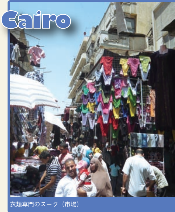
衣類専門のスク (市場)

人々の暮らしを知りたいければマーケットに行ってみるとよい。青空の下、色鮮やかな服がところ狭しと並ぶカイロのスク。テルアビブ市民の台所カルメル市場には新鮮な果物があふれる。イスタンブールのバザールでは小さな電気店が軒を連ねる。活気ある中東の3都市に出掛けてみよう。