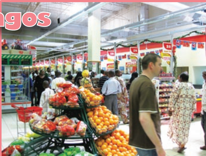
南ア系スーパーマーケット・ショップライト