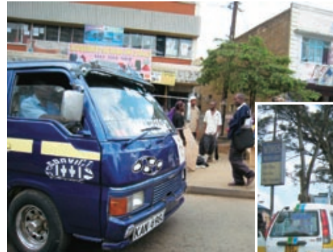
通勤時間帯には「マタトゥ」が路上にあふれる

マタトゥの運転手も車掌も生活がかかっているから、一人でも多く、そして早く乗客を乗せて走る。そこには「お客様第一」や「顧客志向」といった言葉はないに等しい。運転マナーも期待すべくもない。急な割り込みや車線変更は日常茶飯事。渋滞にいら立つ運転手は、路肩