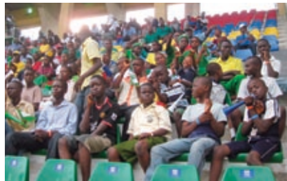
サッカー観戦をする人々（左）、マジック・コーンは、客の注文で追加スパイスを入れて調理する（右）

最近街でよく見かけるのが、「マジック・コーン」。温めたスイートコーンを小カップに入れて販売する小型簡易ショップだ。2009年に1号店が開店。チキン味など9種類の風味パウダーが選択でき、小鍋で混ぜてくれる。当初1カップ250~300ナイラ（約150~180円）だったが、今年に入ってから200ナイラ（約120円）に値下げした。海外駐在員が多く住むビクトリア・アイランド地区やイコイ地区のスーパーマーケット、ホテル、家電量販店やラゴス国内線ターミナルなど、あちこちに店舗がある。とはいえ、人だかりになっている所はまだ見掛けたことがない。人気新商品になるにはもうしばらく時間がかかるのかもしれない。そういえば、今やナイジェリアの食事の代名詞ともなった「インドミ（即席めん）」も、発売当初は振るわず、無料配布などをして時間とコストをかけて市場浸透を図ったという。新しもの好きのナイジェリア人（ナイジェリアン）だが、口にすることは健康に害がないかを気に掛ける。