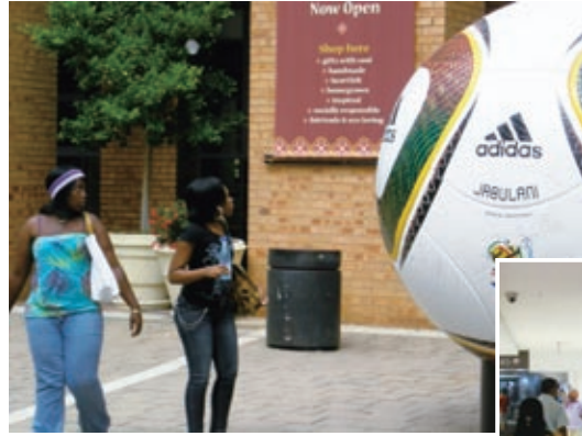
街の広告もワールドカップ一色。パネルに書かれた「KENAKO」の意味は「さあ、いよいよ始まるぞ！」

応援の装いといえば、顔を塗って飾ったり、チームカラーのシャツを着たり、横断幕を掲げたりしているのをよく見掛ける。当地で人気があるのが、飾りの付いた帽子マカラバ（Makaraba）。建設作業員用のヘルメットを改造して飾りを付けたものだ。各国のサポーター向け