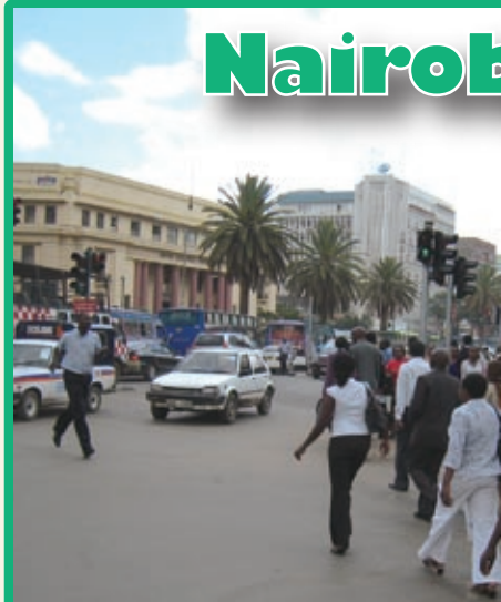
通勤時間は車と人でごったがえす