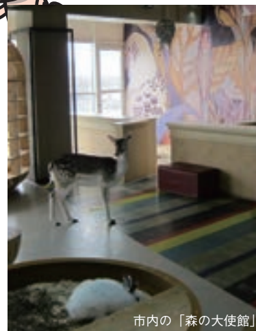
市内の「森の大使館」