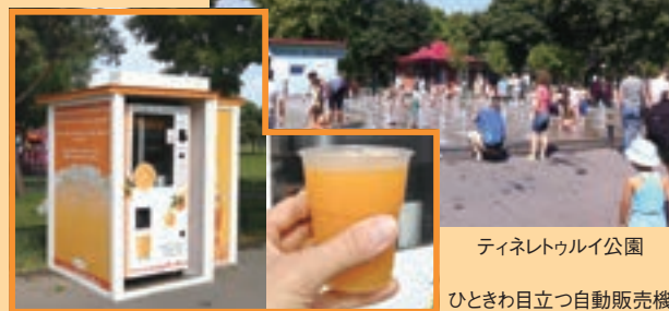
ティネレトゥルイ公園

「無料遊園地」とわが家族が呼ぶ広大な公園。滑り台やジェットコースターなど派手な色をした遊具（一部有料）もたくさん。そんな中で負けじと存在感を示すのが、だいたい色の自動販売機だ。透明な前面からは中がよく見える。お金を入れる。機械が動き出す。上部の網に入ったオレンジが1個ずつポトンと落下、「人」の字のようになった通路の岐路で一度停止、進行方向に尖った部分があり、それによって切り目を入れられつつ左右後方から迫り来るだいたい色の部品に押し出されてパカッと半分に。その後の工程は外からは見えないものの、ギュギュッと搾られ、ジュースとなってコップに注ぎ込まれた。約10秒のプチ工場見学——大人が見ても飽きない。贅沢にもオレンジ7個を使っているとはいえ、1杯210ミリリットルで7レイ（約210円）というのは、当地の感覚からすれば決して安くはない。だが、「アトラクション」と思えばそれだけの価値はあるのかもしれない。もちろん、ジュースは新鮮でおいしかった。