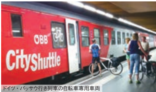
ドイツ・バッサウ行き列車の自転車専用車両

ハウ方面、隣州のノイジードラー湖方面へ行く列車にも自転車は積み込み可能だが、専用車両が連結されることもある。また、国境をまたいで自転車で旅をする場合は、自転車の持ち込み料が無料の往復乗車券もある。天気の良い日にふらりと出掛けたい人にお薦めなのがウエストバーン鉄道だ。この私鉄にも自転車専用スペースが設けられており、空いていれば予約は不要だ。バスもまた、自転車持ち込み可能な路線がある。要予約ではあるが、夏のハイシーズンには、自転車専用バスが各地で運行され、利用者は帰りの体力を気にせず、心行くまでペダルを漕いで移動できるというわけだ。日本では、自転車を列車内に持ち込む際、車輪を外し解体して輪行袋に入れなければならない。それ