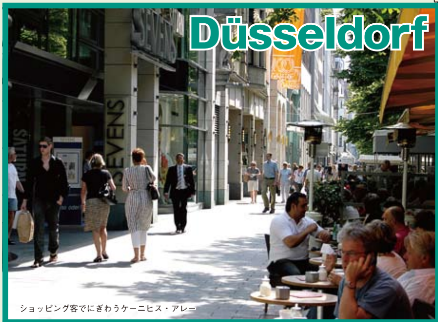
ショッピング客でにぎわうケーニヒス・アレー