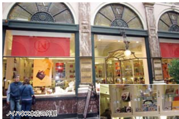
ノイハウス本店の外観

ベルギー王室御用達ブランドは、5年ごとに厳密な審査を経て認定される。11年現在、ゴディバのほか、ノイハウス、ガレー、ヴィタメールが認定されている。中でも最も歴史あるのは、1857年に菓と菓子を扱う店として創業されたノイハウス。ベルギーチョコを世界的に有名にしたといわれる。成功の要因は何と言っても多様な味の商品を世に送り出したことだろう。1912年、焙煎したナッツ類に加熱した砂糖をあえてカラメル化した「プラリネ」を、ジョン・ノイハウス氏が初めて開発した。これによりさまざまな味付けや