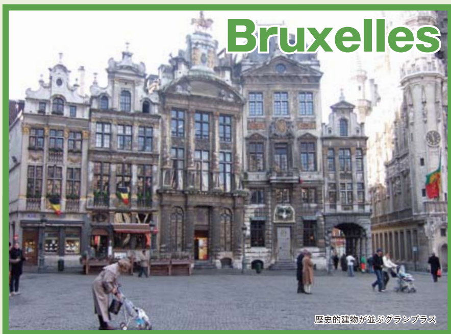
歴史的建物が並ぶグランプラス

デュッセルドルフでは、20年余をかけてきた目抜き通りと公園をつなぐ再開発プロジェクトが数年後に完成予定。ブリュッセルでは、150年余の歴史あるチョコレート・ブランドショップが軒を連ね、お気に入りチョコを探す楽しみがある。欧州2都市から届いた暮らしの断面を紹介。