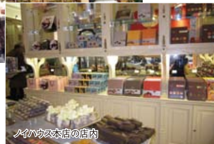
ノイハウス本店の店内

成型が可能になった。さらに、今では定番の箱詰め販売も始めた。当初、フライドポテト販売で使うような