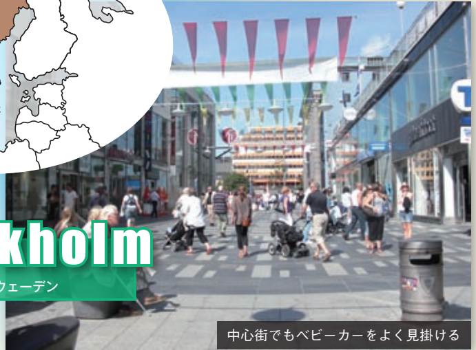
中心街でもベビーカーをよく見掛ける