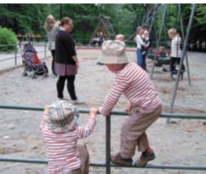
公園には子どもが遊ぶ

スウェーデンは今、いわゆるベビーブームの渦中にある。親になる年齢は上がっており、2009年の平均では、第一子出産時の母親の年齢は28.94歳、父親は31.43歳だった。年齢が高くなってきたのは、十分な額の育児休暇手当がもらえるよう職を確保してから子どもをもうける傾向があること、国民の多くが大学に行くようになり労働市場デビューが遅くなってきていることとも関連がある。育児休暇手当支給期間は480日、うち390日間は出産直前の給与の約80%相当が支給され、残り90日間は一律1日当たり180クローナ（約2,200円）が支給される