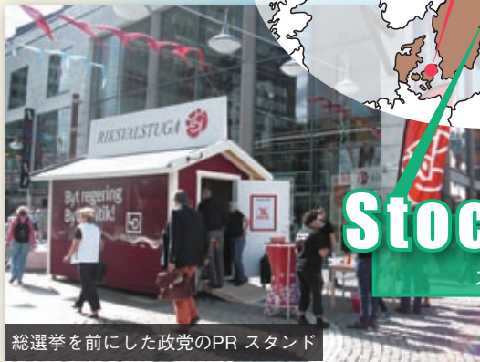
総選挙を前にした政党のPR スタンド