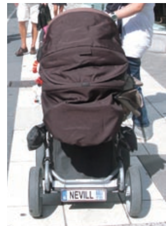
ナンバープレートには子どもの名前

中でもベビーカーは子育ての必須アイテム。当地では、そのままバスや地下鉄、電車に乗り込むことができる。もちろん折り畳んで車のトランクに入れることも可能だ。冬は保育所の送り迎えの際などに雪道を移動する必要があるのも求められる。新品のベビーカーは3,000クローナ（約3万6,000円）くらいから買えるが、高級ブランド品は1万クローナ（約12万円）を超える。乳児を寝かせる0～1歳児用乳母車のほかに、子どもの成長に合わせて1～3歳児用も必要となり、親にとっては物入りだが、金に糸目を付けていないように見受けられる。最近ではナンバープレートのような名前プレート（右上写真参照）を買って付けるのが流行っている。スウェーデンの親は楽しみながら子育てをしているようだ。