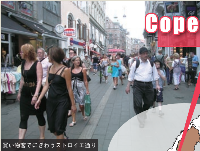
買い物客でにぎわうストロイエ通り

北欧諸国は福祉先進国といわれる。デンマークは個人の医療負担が少ない。だが歯の治療は例外だ。スウェーデンは手厚い子育て支援で出生率が上がった。高級ブランドの子ども用品が人気を博す。今回は、高福祉高負担社会の暮らしの一端をのぞいてみよう。