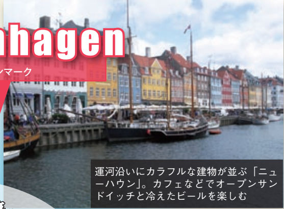
運河沿いにカラフルな建物が並ぶ「ニューハウン」。カフェなどでオープンサンドイッチと冷えたビールを楽しむ