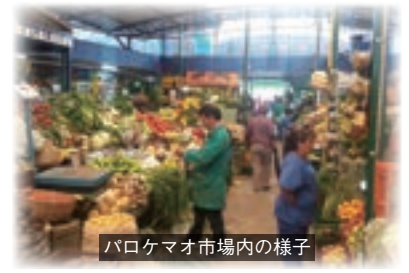
パロケマオ市場内の様子