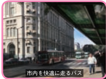
市内を快適に走るバス