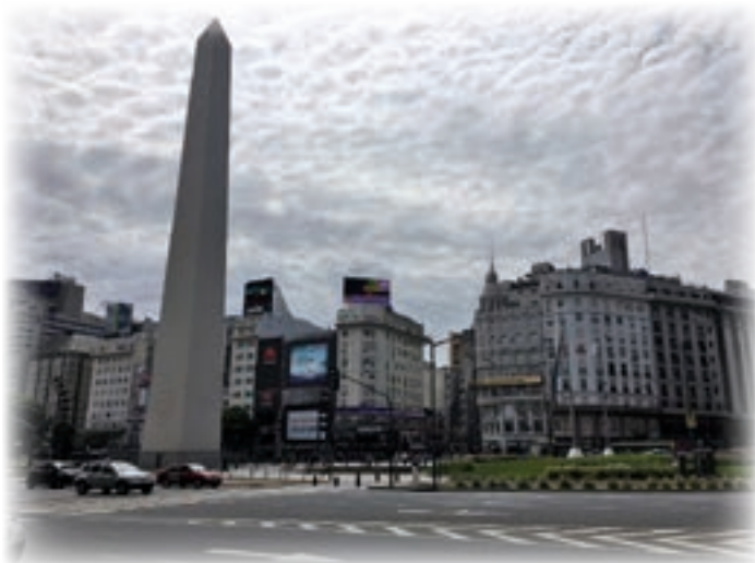
街のシンボル「オベリスク」。市の誕生、400年を記念して建てられた