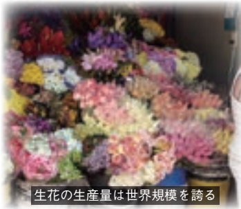
生花の生産量は世界規模を誇る