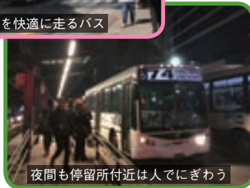
夜間も停留所付近は人でにぎわう