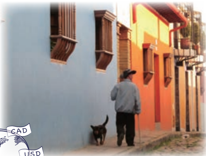
趣きのあるボゴタの旧市街