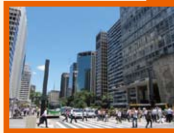
パウリスタ大通り