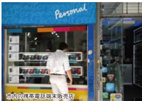
市内の携帯電話端末販売店

スマートフォンの販売が急拡大している理由はまず、大手家電チェーン店による20回以上の無利子分割払いの実施にある。加えて一説には年率30%と言われるインフレがある。そのため、市民にとっては高額という感覚がない。「ブラックベリー」は699ペソ（約