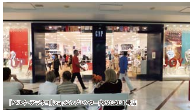
「パルケ・アラウコ」ショッピングセンター内のGAP1号店

首都サンティアゴでは物資に関して不自由はないものの、日本と比較してコストパフォーマンスが悪いと感じる製品がある。その代表格がカジュアル衣料や下着類である。リーバイス501が日本の実売価格と同程度の6,000円で販売されている（下表参照）。チリ人の平均月収が約37万ペソ（約5万5,000円）という水準を考えると日本よりかなり割高だ。Tシャツもすぐにくたびれてしまうような製品が日本より高い価格で売られている。