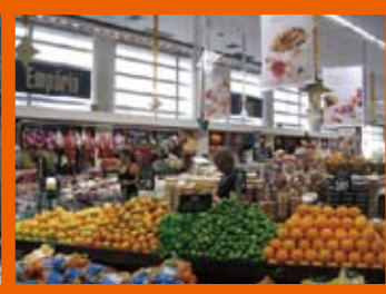
市内スーパーマーケット