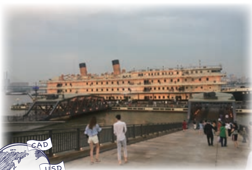
揚子江に浮かぶ客船