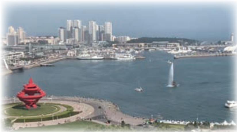
五四広場のモニュメント「五月の風」(左)とヨットハーバー