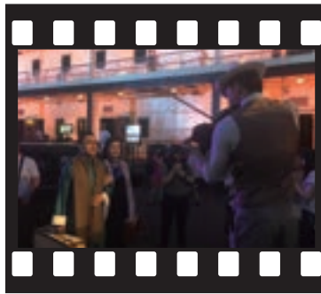
雰囲気のあるデッキで記念写真