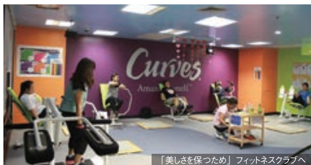
「美しさを保つため」フィットネスクラブへ

2012年に進出した米国系のカーブス・タイランドは、この2年で店舗を4店舗まで拡大。会員が「女性限定」であること、「1回30分のエクササイズ」という通いやすさを売りにしている。会費は月額1,500バーツ（約4,800円）で、30台後半のアップパーミドル所得層の会社員が顧客の中心を占める。フィットネスクラブに通う動