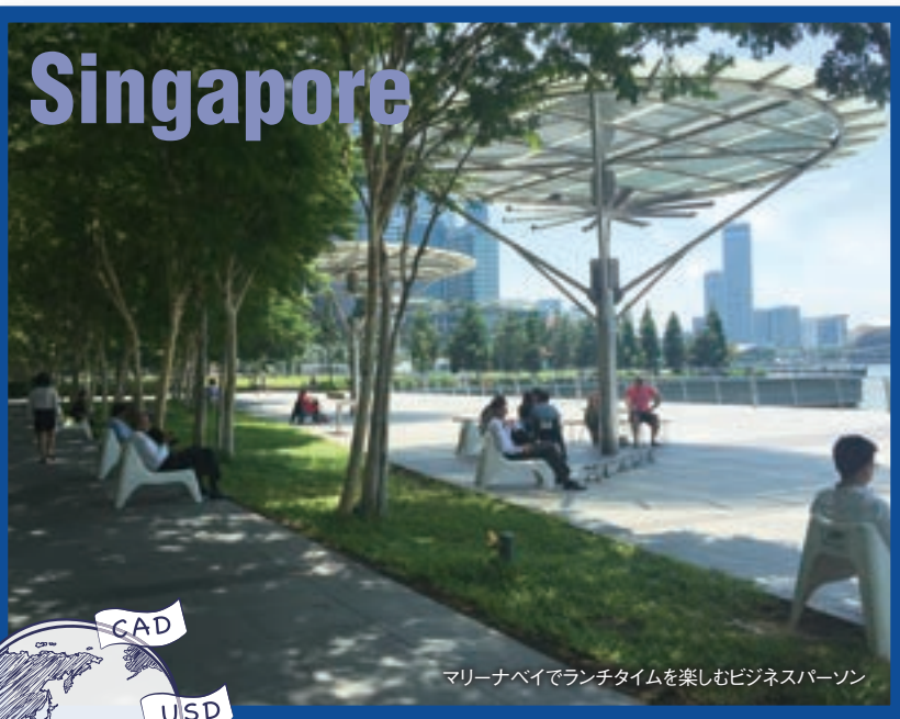
マリーナベイでランチタイムを楽しむビジネスパーソン