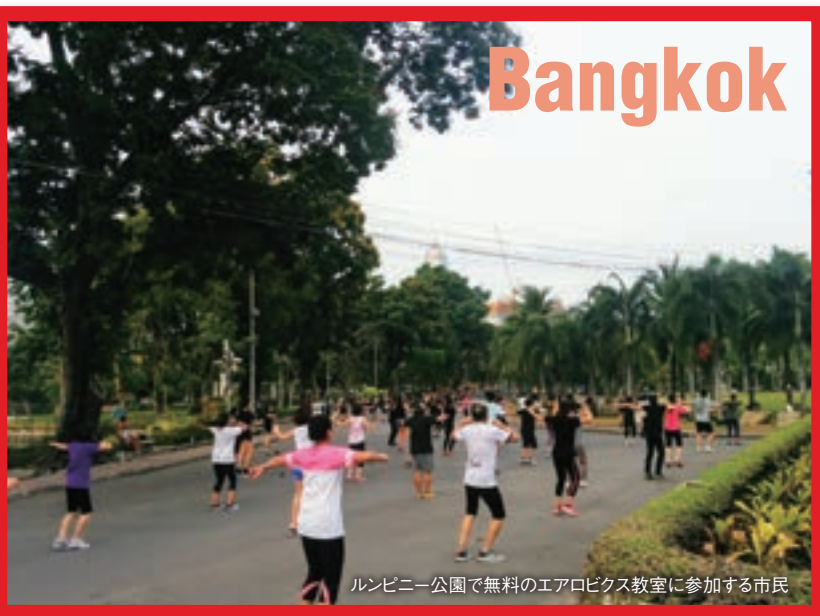
ルンビニー公園で無料のエアロビクス教室に参加する市民