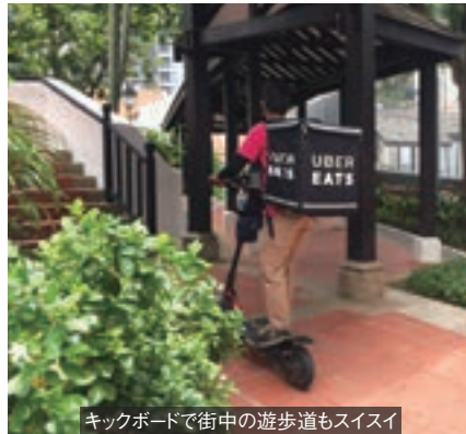
キックボードで街中の遊歩道もスイスイ

当地では長年、フードデリバリーといえば、注文しても配達されるまで数時間かかるのが当たり前で、メニューの選択肢も限られていた。ところが2012年3月、ドイツのフード・パンダがフードデリバリーサービスに参入。携帯アプリやインターネットで注文すれば、レストランの食事を30~40分程度で配達するサービスを始めた。同社と契約するレストランは現在、インド、日本など各国料理を提供する約1,500店。利用者が配達希望先の住所を入力すると、配達可能なレストランと配達予想時間が表示され、示されたメニューから料理を選択できる。料金は食事代と配達料の3シンガポール・ドル（約240円）。レストランで7%の消費税と10%のサービス料金を支払うことを考えれば、この方が割安かもし