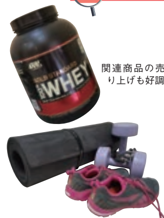
関連商品の売り上げも好調