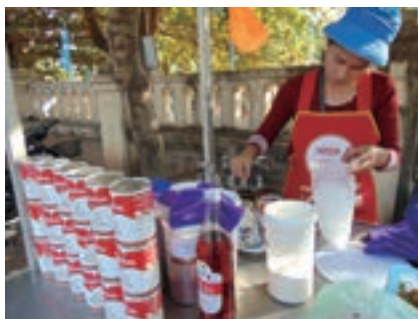
練乳の缶がアイスコーヒー店の目印。ピザ(写真右上)とビニール袋に入ったアイスコーヒー(同、右下)

軒先に積まれた練乳の缶の山。それが、アイスコーヒー店の目印だ。アイスコーヒーを注文してみる。まずガラスの4分の1まで練乳を入れる。そこに濃厚な熱いコーヒーを注ぐ。さらに大量の砂糖を投入。ガラスの中をかき混ぜ、混ざり合うのを待つ間にたっぷりの氷が詰められた容器が用意される。容器はもちろん東南アジアではおなじみのビニール袋だ。温かいコーヒーは大量の水と混ざり合い、瞬く間にアイスコーヒーの出来