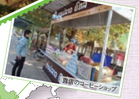
露店のコーヒーショップ