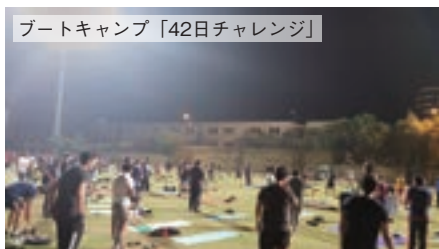
ブートキャンプ「42日チャレンジ」

では、1食380ルピー（約440円）のダイエット料理、1杯300ルピーのデトックス・ジュースがメニューに