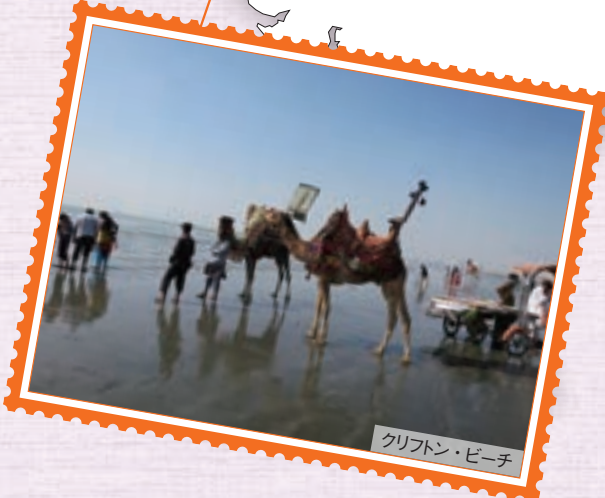
クリフトン・ビーチ