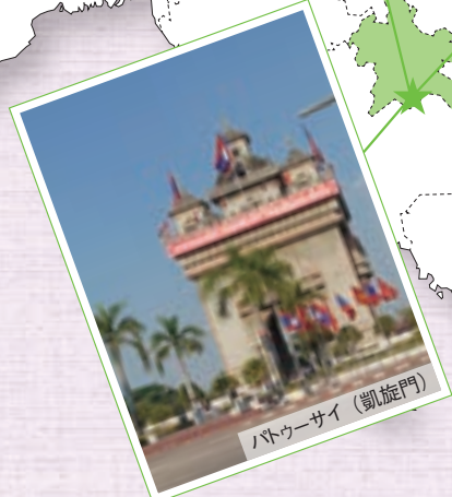
パトウサイ (凱旋門)