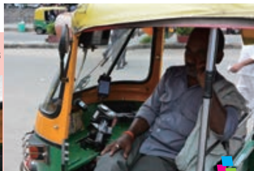
オートリキシャにもスマホが