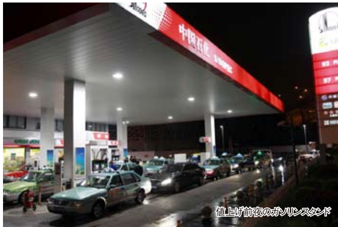
値上げ前夜のガソリンスタンド

一方で、中央政府の政策により、12年3月20日からガソリン価格が値上げされた。乗用車に最も使われ