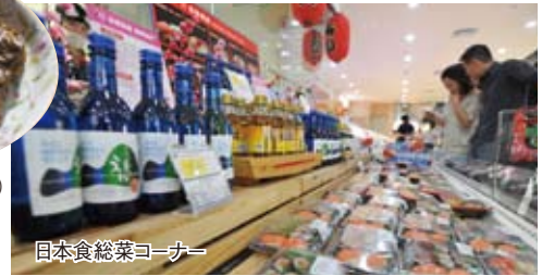
日本食総菜コーナー

が出現。100%満足というわけにはいかないが、コロッケ、エビフライ、すし、金時豆など日本食総菜が並ぶコーナーが私のお気に入りだ。