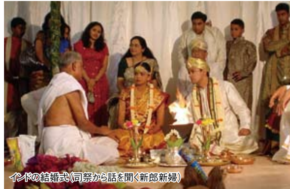
インドの結婚式(司祭から話を聞く新郎新婦)

ました。実は今風に恋愛結婚なのですが、祝福されて結婚するため、彼は自分の両親に交際相手とのお見合いをセットしてくれるように働き掛けたそうです。当初は反対した両親も結局は折れて、彼は彼女と晴れて「見合い結婚」できることになりました。おめでとう！