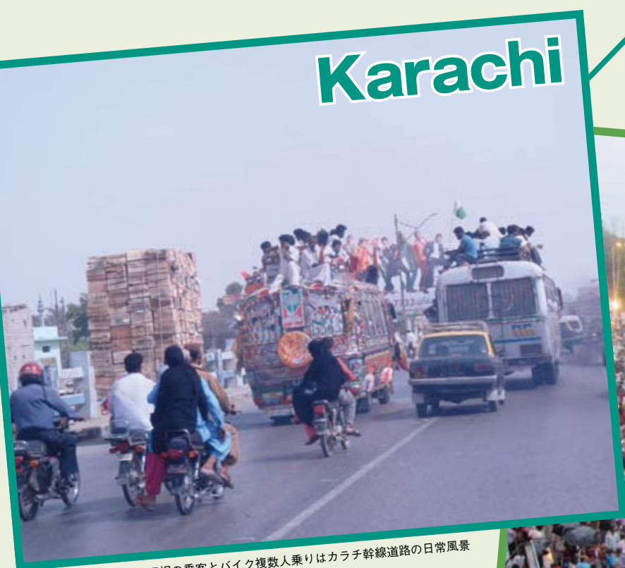
バス屋根の乗客とバイク複数人乗りはカラチ幹線道路の日常風景