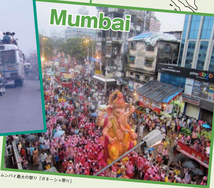
ムンバイ最大の祭り「ガネーシャ祭り」