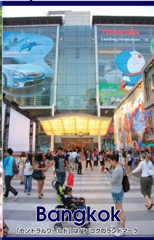
オーチャード通り