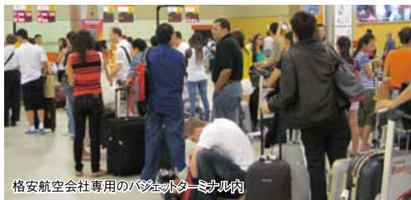
格安航空会社専用のバスケット・ミニマル内