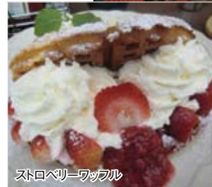
ストロベリーワッフル