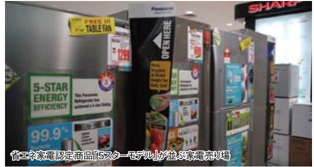
省エネ家電認定商品「5スターモデル」が並ぶ家電売り場

ブ・スター（5つ星）モデル」に限定。日系6社を含む家電メーカー12社165品目から選べる。価格帯は冷蔵庫が1,000～2,000リンギ（約2万6,500～5万3,000円）、エアコンは2,000リンギ前後が中心だ。