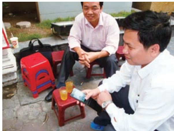
道端の茶屋でスマートフォンを使う人に出会った

どの店も「1日15~20台は売れている」という。購入者は「大部分がベトナム人」とのこと。ハノイ市の1人当たりGDPは約2,000ドルだが、その半分近くもする携帯電話が売れていることになる。店舗回りをしている間にも、スマートフォンらしきものを持った男性を路上の茶屋で見掛けた。持っていたのはiPhone4(写真上)。この茶屋のチャダー(冷えたお茶)は1杯2,000ドン(約0.1ドル)だ。1杯10円ほどのお茶を飲みながら、10万円近い携帯を使う…。ベトナム消費市場や市民生活の変容が表れているような気がした。