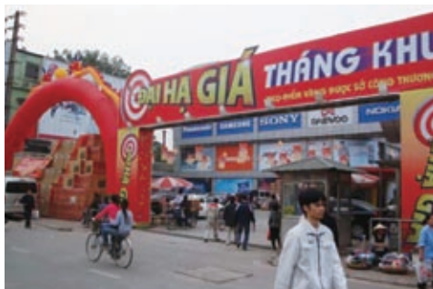
拡販キャンペーン中の家電量販店

のようなスマートフォンを持っている人をよく見る。これら携帯電話を取り扱う店舗も増えたようだ。数店で価格を聞いたところ、iPhone4は容量やモデルの新旧にもよるが約1,800万~2,200万ドン(約830~1,020ドル)。