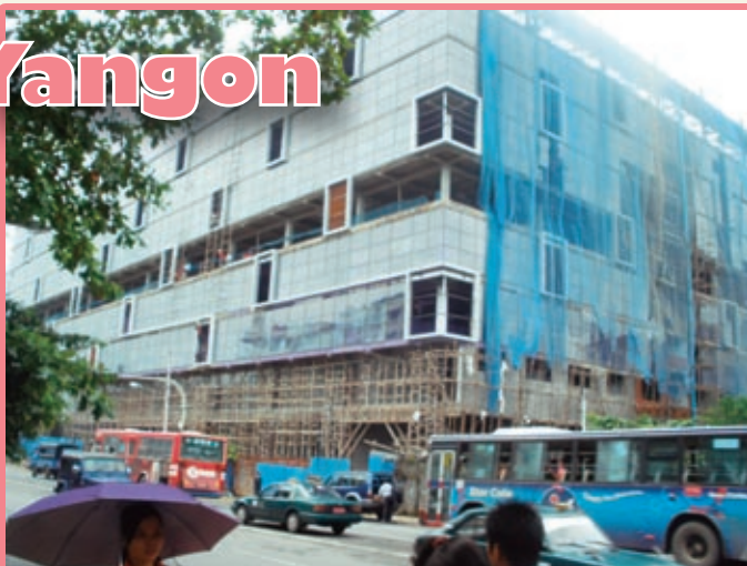
大型ショッピングセンター建設が急ピッチで進む