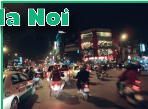
バイクと車が夜の街を疾走