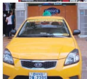
電話1本で来てくれるメータータクシー

今のところ大手のメータータクシー会社は2社。前述のトランスチョイスカンボジア社と中国資本のグローバル社だ。グローバル社の開業は08年だからタクシービジネスではこちらの方が先駆者だ。現在32台を保有し、1日300人程度の乗客数があるという。初乗り料金は1キロまで2,500リエル（約0.6ドル）、その後160メートルごとに1,000リエル（約0.25ドル）加算。