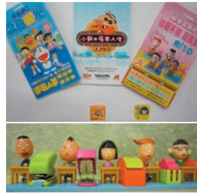
シールキャンペーンの台紙とシール（上）どのキャラクターが入っているかは、袋を開けてのお楽しみ

台湾では2008年に民進党から国民党政権に代わり、それ以降大陸との関係は改善傾向にある。中国本土からの台湾観光も緩和され、今では最も多いのは中国人観光客である。中国文化のさらなる流入も予想される。だが、コンビニのシールキャンペーンで採用される景品を見る限り、依然として日本のアニメキャラクターの人気の高い。台湾と中国の距離が近くなってきているとはいえ、台湾において日本ブランドはまだ健在のようだ。