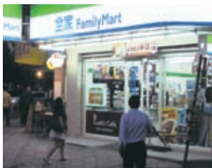
顧客獲得に各店工夫を凝らす

台湾で多店舗を展開しているセブン-イレブンとファミリーマートは頻繁に「シールキャンペーン」を行っている。同じチェーンで一定期間内に配布されるアニメキャラクターのシールを一定枚数集めると、景品（キャラクター人形の付いた文具やペンなど）もしくは一般商品に引き替えられるというものだ。5～8月に実施されたセブン-イレブンの「ちびまる子ちゃん」キャンペーン