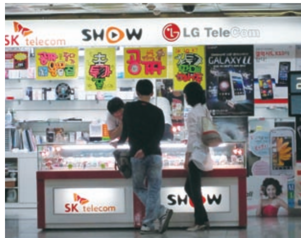
カップルで機種選び

スマートフォンで街の風景は大きく変わった。市内すべてのバス停留所で、バスの到着予定時刻がリアルタイムで確認できる。急に天気が悪くなったり渋滞でなかなかバスが来なかったりすると、すかさず近くのコーヒーショップを検索。コーヒーを飲みながら無料ネット接続