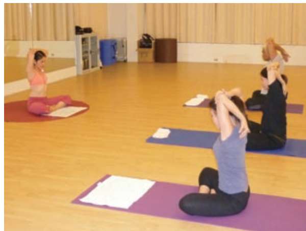
今はやりのヨガ道場

マニラ首都圏のマカティ市内にはスポーツクラブが多数ある。会員制のスポーツクラブのヨガ教室を訪ねてみた——。仕事帰りと思われる生徒がやってきた。お互い談笑するでもなく淡々と着替えを済ませ、軽い準備運動をしながらインストラクターを待つ。前のレッスンから間もないせいか、噴き出す汗をぬぐいながらインストラクターが現れた。座るなり腹式呼吸を数回行い瞑想（めいそう）に入る。生徒もそれに倣う。約5分間の瞑想を経てインストラクターはヨガのポーズを説明しはじめた。