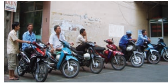
客待ちするセーオム

都市の発展に道路整備が追いつかないホーチミン市内は、至るところで工事中。バスや車の