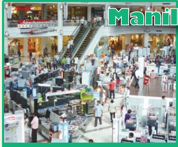
グロリエッタショッピングモール