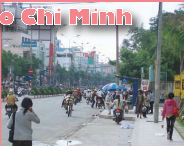
街はバイクの喧噪につつまれる