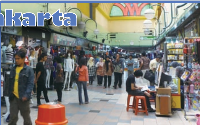
ブロックMバスターミナル地下の商店街。バス待ち時間の有効活用