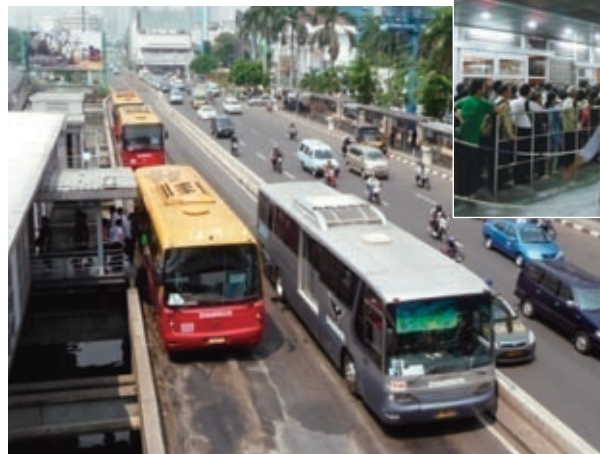
市民の足「トランスジャカルタ」、通勤時の混雑（右上）

インフラ整備もなかなか進まない。混雑して暑苦しい乗換ターミナルに扇風機が取り付けられたのは最近のこ