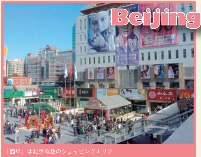
「西单」は北京有数のショッピングエリア