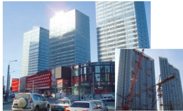
高層マンションが目立つ市内（左）、続々と建設が進む（右下）

加えて大連の場合、東北三省の内陸都市、長春やハルビンなどの金持ちが、夏には海を、冬には暖を求めてやってくる。彼らが別荘として大連の不動産を購入する。そのほか、投機目的の購入も多い。夜、街を歩きながら、