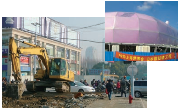
街中で道路工事（左）。完成間近の万博日本パビリオン（右上）

市内で着々と進められる「化粧直し」に住民の思いは複雑だ。筆者の場合も、一昨年まで1時間だったバス通勤の時間が、工事に伴う交通渋滞などから昨年以降は2時間以上かかるようになった。万博に関する、住民509人を対象とした調査結果が、1月20日に復旦大学メディ