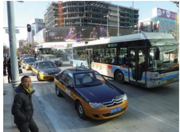
客待ちするタクシー

業界関係者によれば、小型車が売れた要因はもう一つあるという。ガソリン消費税の引き上げだ。その結果、小排気量車が好まれたというのだ。もっとも、09年の減税対象ではなかった1,600cc超の乗用車の売れ行きも前年比2割増。小型車には及ばないが悪い数字ではない。ちなみにタクシー料金は上がった。3キロ走ると燃料税