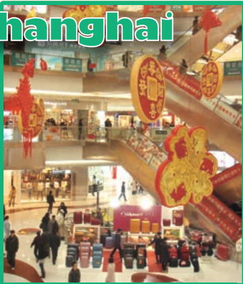
春節の飾り付けが施された「竜之夢」ショッピングセンター