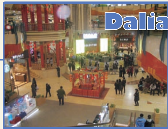
「青泥窪橋」ショッピングモールに繰り出す人々