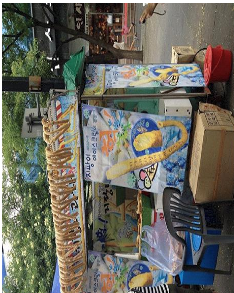
□ネットに掲載された「杖型アイスクリーム」の商品写真