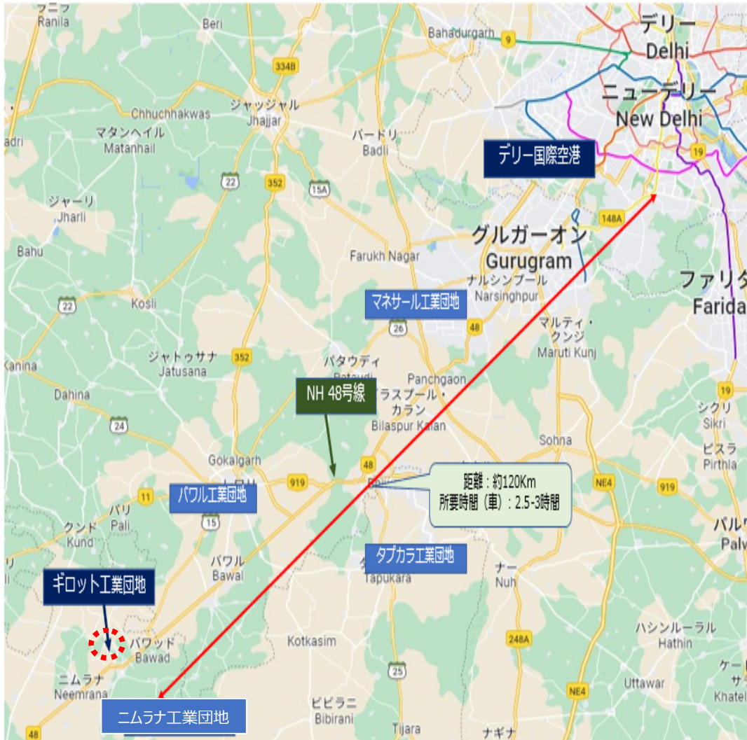
図1 ギロット工業団地所在地