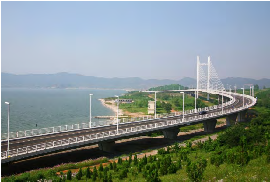
(五つの沿海重点開発地域をつなぐ濱海大道)