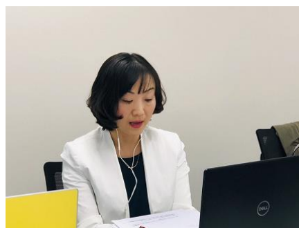
講演「中国での模倣品対策について」の様子