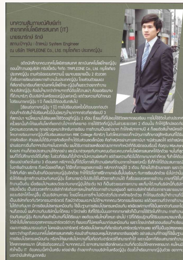
大学広報誌 OBインタビュー記事掲載