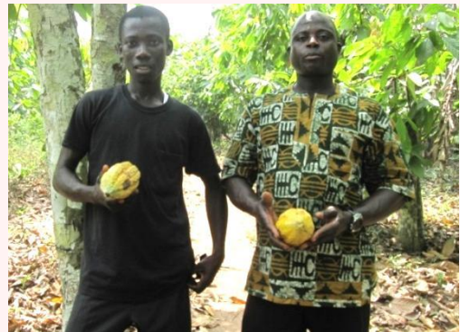
カカオの生産者。 左が弟(20歳)、右が兄(40歳)