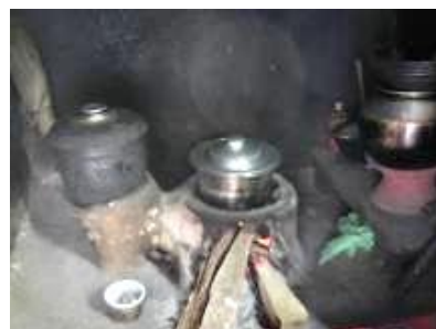
食事は薪で調理する

【紅茶・おやつ】1日4回(朝起きた時、10時、15時、19時)紅茶を飲む。 子供たちは時々、おやつにヨーグルト、ビスケットなどを食べる。