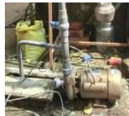
水を汲み上げるモーター